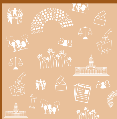
Formación Ética y Ciudadana