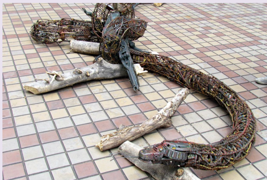
David Berkowitz, “Metal Animal Sculpture Exhibit in Convento San Francisco - San Telmo - Buenos Aires - Argentina” , Flickr.

Estas son algunas imágenes de sitios de la ciudad que dan miedo: