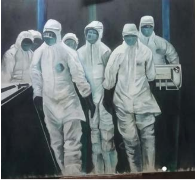
Gentileza de Diana Dowek Pandemia