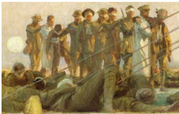
Soldados gaseados, Primera Guerra Mundial, John Singer Sargent.