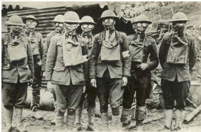
THE AMERICAN SOLDIERS IN PRESENCE OF GAS - 42 ND DIV. ESSAY-FR. 9-20-18