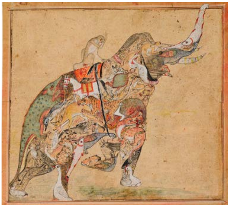
Elefante compuesto con simio C. 1730. India, Rajasthan, Kota.

nueva cercanía respetuosa y no posesiva nos resguarde del salto letal de los virus entre especies. Murciélagos, pangolines y antropoides conviviríamos sin grandes riesgos para nuestras identidades biológicas en la misma nave que, sin remos ni velas, boga alrededor del sol. ¿Por qué no proponer, a modo de nueva insignia de nuestro coraje la imagen del elefante compuesto, formado por la yuxtaposición de decenas de seres humanos y otros animales, que inventaron los miniaturistas del Gran Mogol en la India de los siglos XVII y XVIII? El más adecuado sería uno fechado en 1730, montado por un simio y con su trompa erguida. Se diría que está feliz de darnos ánimos. ◆