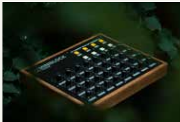
Mateo Ferley | Teo Bonilla

Busca subvertir la relación entre los humanos y las máquinas haciendo tecnología que se adapte a cada persona. Yaeltex crea interfaces expresivas hechas a medida; robustas, armoniosas y únicas.