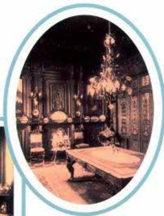
Arriba a la izquierda: Antigua Sala de Abanicos. Abajo y a la derecha: Antiguo Gran Comedor.