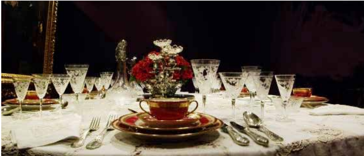
Juego de mesa de porcelana policromada y dorada de Limoges, cristalería de Baccarat, platería y mantel, fines del siglo XIX y comienzos del XX.

Se optó por un estilo neo-renacimiento italiano, cubriendo sus paredes y techo de tallas debidas al arte de los Briganti, se lo iluminó con cuatro apliques y un candelero de dieciséis brazos de la casa Perazzo y Cía., se lo dotó de un cúpula y ventanales laterales de vitraux, unos de producción nacional y otro con cristales de Bohemia, probablemente traído de las casas de los Fernández Blanco en Europa. Se encargaron cuatro tapices a la firma francesa Braquenie et Cie., con motivos bucólicos, se bordaron los manteles con las iniciales de los dueños de casa y se adquirió la vajilla de porcelana en Limoges y la cristalería fue tallada a mano en Baccarat. El juego de té era de plata de Sheffield y se servía en una mesa del mismo material precioso sobre un doble presentoire y en tazas de porcelana de Meissen.