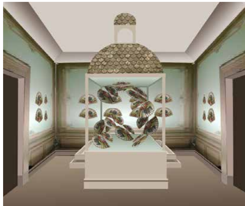
Renders vistas Sala de Abanicos.