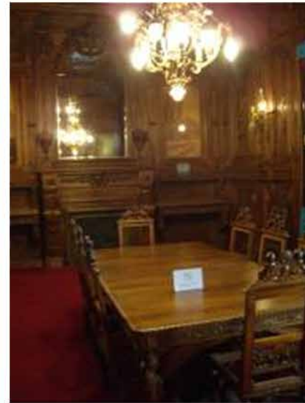
Sillas restauradas, tapicería de Braquenie et Cie. y vista Salón Comedor antes de la restauración.

El proceso de restauración de las carpinterías -boiserie y pisos de roble Eslavonia – la araña central, apliques, vitreaux de la cúpula y ventanas permiten reproducir el comedor montado rematándonos en un viaje imaginario a los comienzos del siglo XX.