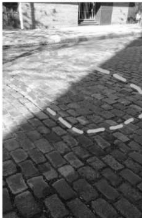
F. Bilbao 2491

Vale agregar que contradictoriamente, en febrero 2021 se realizaron obras controversiales, las que en forma intempestiva aparecieron cuadrillas para asfaltar las calles Remedios 2600 y Francisco Bilbao 2300 y más con el comprobado desconocimiento absoluto por parte de funcionarios de la propia Comuna 7. Las mismas fueron resistidas y rechazadas por importantes reclamos y protestas vecinales, las que tuvieron difusión tanto en medios radiales capitalinos y medios gráficos barriales.