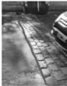
F. Bilbao 2186

Se detectó con grata sorpresa que se presentó una cuadrilla de la empresa EATON al servicio del GCABA, la cual mediante martillo neumático removió un gran parche de asfalto sobre la misma y REPUSO EL ADOQUINADO en forma prolija e impecable. Otra buena noticia. También ocurrió algo similar en F. Bilbao 2200 intersección con Esteban Bonorino. Allí se efectuaron similares tratamientos, en un sector levantando un notable hundimiento de adoquinado (6 m 2 ) y restableciéndolo al nivel correcto del peralte de la calzada, y el otro una franja transversal (8 m 2 ) de cordón a cordón de Bilbao al 2100. Estas acciones y de buen proceder en post del mantenimiento a calzadas adoquinadas, es un misterio ya que se desconoce bajo qué orden o proyecto del GCABA se efectuó, ante nuestras consultas.