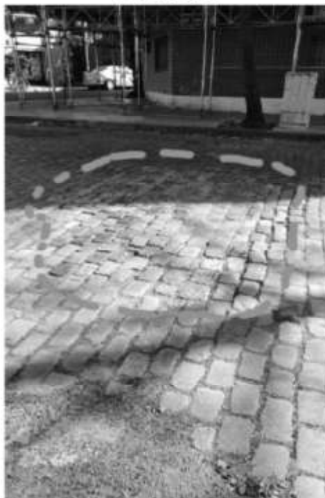
F. Bilbao 2491