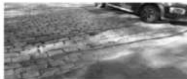
F. Bilbao 2186