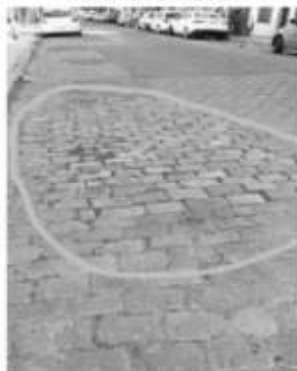
F. Bilbao 2201