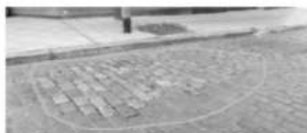
F. Bilbao 2201