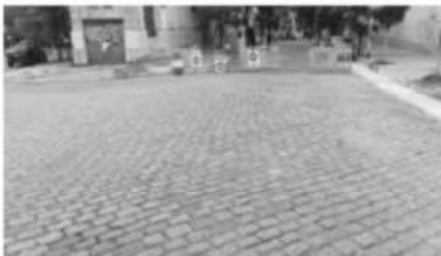
Empalme de Remedios con F. Bilbao