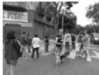
Protesta vecinal en Bilbao y Varela febrero 2021