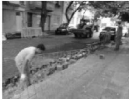
Gregorio de Laferrere

En Asamblea 1646, 1652 y 1692 esquina Thorne se ha proyectado la construcción de 3 Torres. Los vecinos y vecinas durante febrero y lo que va de marzo vienen realizando los días vienes encuentros de protesta y ya han recolectado 1700 firmas para acompañar la petición al GCABA para que no se realice esa obra. Esa zona es residencial y además la obra implica un daño ambiental y con ello a la calidad de vida de la población.