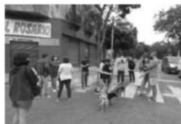
Protesta vecinal en Bilbao y Varela febrero 2021