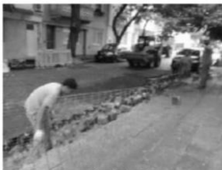
Gregorio de Laferrere