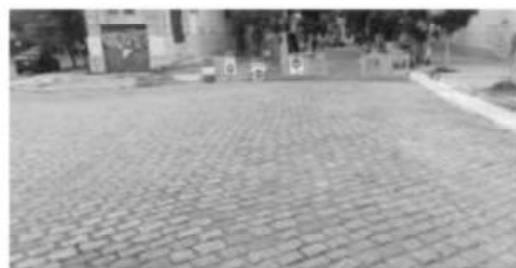
Empalme de Remedios con F. Bilbao