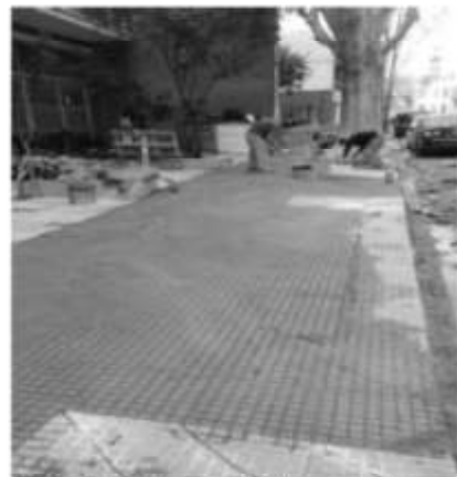
Rivera Indarte 454 luego de la intervención