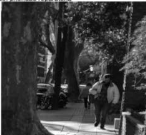
Rivera Indarte 454 antes de la intervención