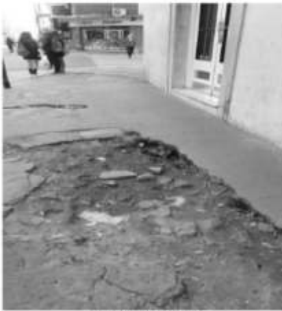
San Pedrito 106

En este último tiempo estamos observando que se están haciendo veredas en muchos lugares, sobre todo de buena visibilidad para la ciudadanía. En tal sentido nos preocupa que se rehacen veredas cuyo estado no era tan crítico y no se están llevando a cabo en lugares, tal vez con no tanta visibilidad, que desde hace tiempo su estado es malo y peligroso para l@s transeúntes y, obviamente tienen un grado de prioridad reparatoria mayor a las antes mencionadas.