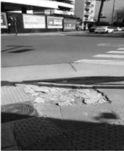
Av. Eva Perón y Malvinas Argentinas

La rampa de Rivadavia y Pedernera continúa sin ser reparada al igual que: