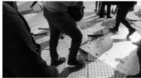
Esquina San Pedrito y Rivadavia