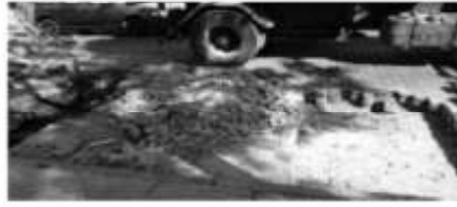
Camacúa al 400 entre Av. Directorio y Bilbao.