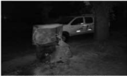
Buzón eléctrico incendiado

EDESUR demostró una vez más que no solo no cuenta con mantenimientos preventivos en los cableados, estaciones transformadoras, sino también carece de disponibilidad de personal idóneo en sus filas para brindar un servicio confiable y estable a sus clientes.