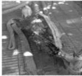
Empalmes eléctricos degradados

Por COMISIÓN DE MANTENIMIENTO BARRIAL del CCCC 7