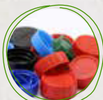
Tapas de plástico