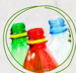
Botellas de plástico