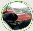
Papel de revista