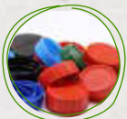
Tapas de plástico