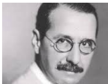
Constancio Cecilio Vigil (1876--1954)