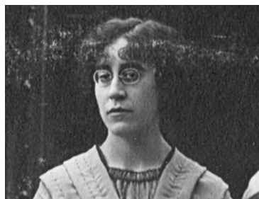
Rosario Vera Peñaloza (1873--1950)