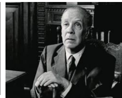
Jorge Luis Borges (1899--1986)