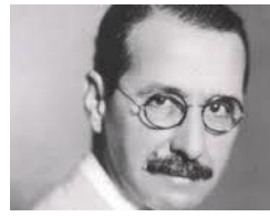
Constancio Cecilio Vigil (1876--1954)