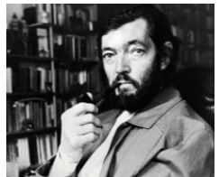
Julio Cortázar (1914--1984)

El Programa Huellas de la Escuela acompaña a las instituciones educativas en la puesta en valor de sus fondos patrimoniales y colabora en la organización de sus archivos escolares. El hallazgo de documentos inéditos sobre profesores y estudiantes de nuestras instituciones educativas auspician nuevas lecturas sobre las biografías de personalidades de nuestra historia.