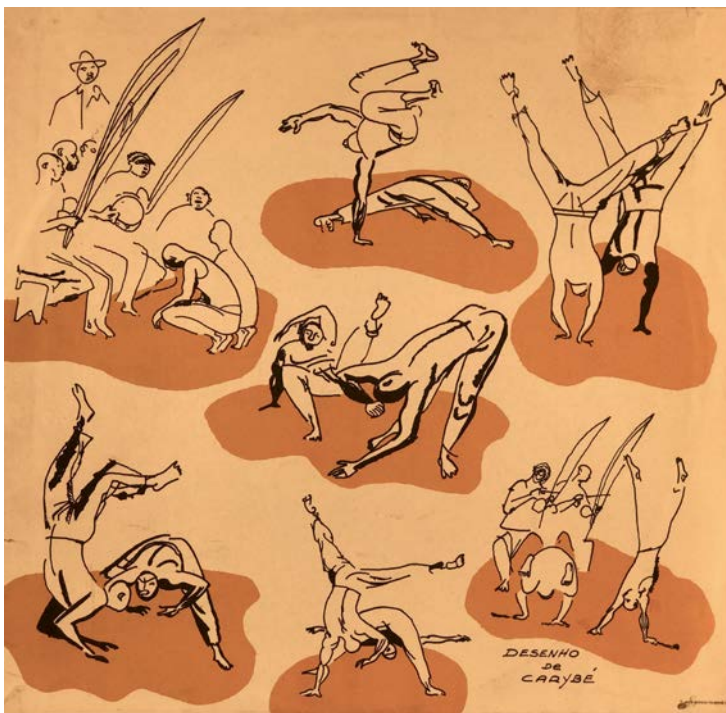
Ilustración de Carybé