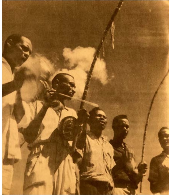
Fotografías de Salomao Scilar y Marcel Gautherot

internacional (Reis, 2009: 109) con los destacados Mestres Cobrinha Verde (Rafael Alves França, 1908-1982), Traíra (João Ramos do Nascimento, 1925-1975) y Gato (José Gabriel Góes, 1929-2002). Editado primero con el título de “Capoeira”, fue el segundo de la serie Documentos folclóricos brasileiros de la editora carioca Xauã, relanzándose nuevamente en 1964 (Velhos Mestres, 2016) con el título “Mestre Traíra - Capoeira da Bahía”, cuya versión en CD se consigue actualmente. La primera edición