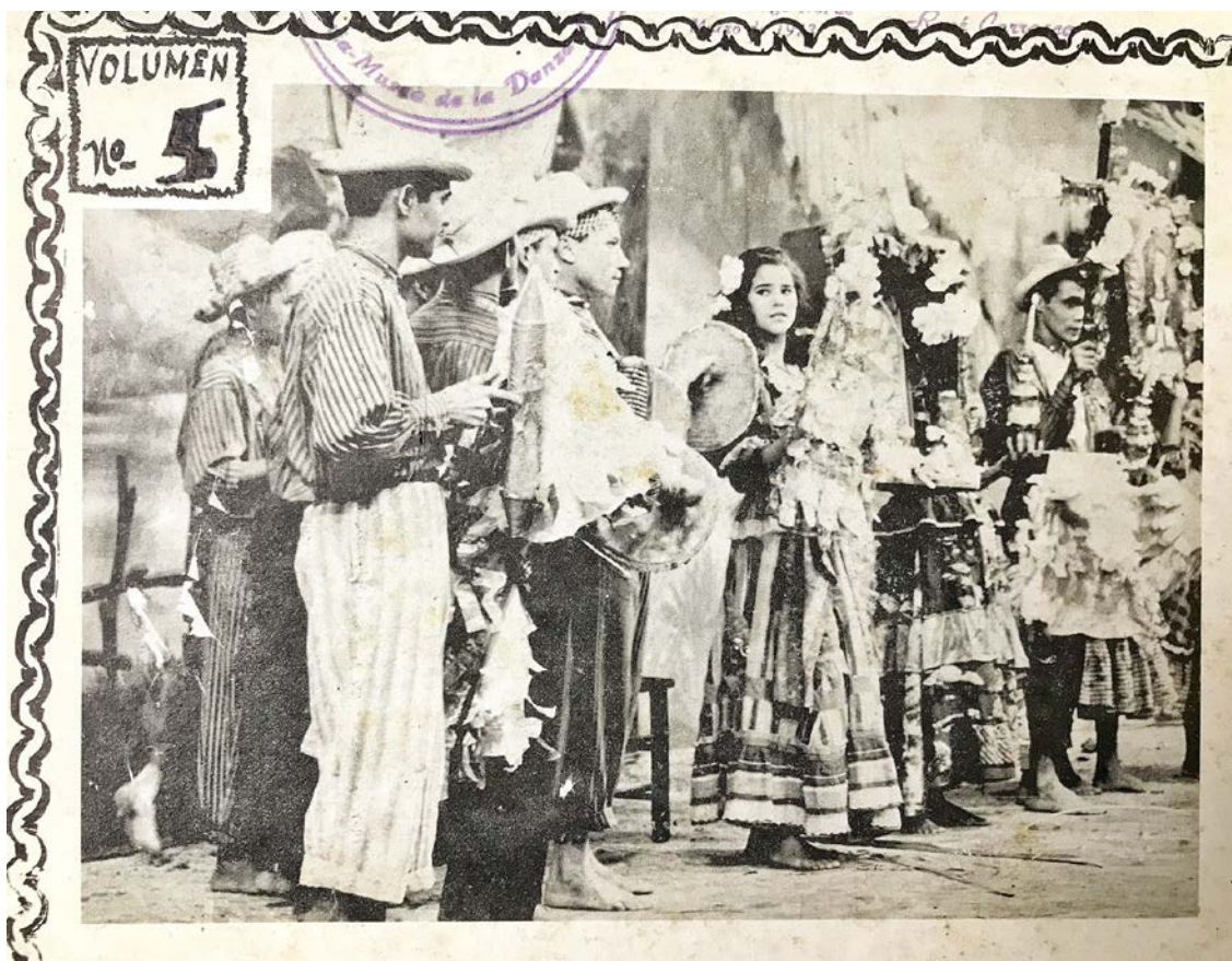
Representación del “Rito en salve” a la Santísima Cruz frente al altar de Nino Solano, Rey de una Hermandad religiosa de El Seibo.

Hablando en criollo seibano [iii] , las letras “L” y “D” son omitidas al final de palabra después de vocal. Ejemplos: “tocar” cambia por “tocá”; “beber” por “bebé”, así como “tuerto” por “tueto”; “acordión” por “ecodion”; “verdad” por