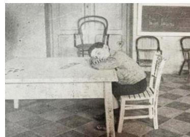
Imágenes del libro "Alto educación pedagogía científica" de María Montessori.

Las múltiples pedagogías fueron diseñando, a través de su desarrollo, los descubrimientos y conclusiones que realizaban entonces las ciencias, algunas incipientes, como la psicología, la antropología y la sociología, aportando saberes que significaban en la educación. Las diferentes propuestas educativas que surgieron entonces estructuraron la relación tanto de niños y niñas con los adultos, como los espacios específicos para la enseñanza y los recursos didácticos a utilizar.