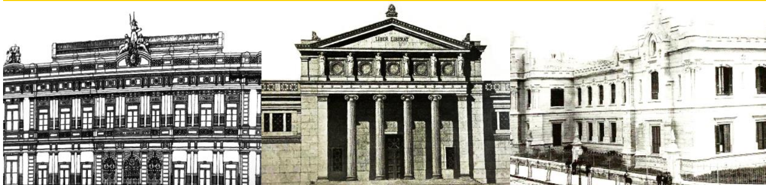
Escuela Normal Superior N° 9 "Domingo F. Sarmiento"