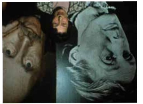
Imagen de tapa: Victoria Dcampo, París, 1939.

Pionera de la fotografía a color, socióloga y autora del primer estudio doctoral sobre la historia de la fotografía, mujer de avanzada en el fotoperiodismo, Gisèle Freund es celebrada principalmente por la colección de retratos que supo incluir a escritores y artistas canónicos del siglo veinte