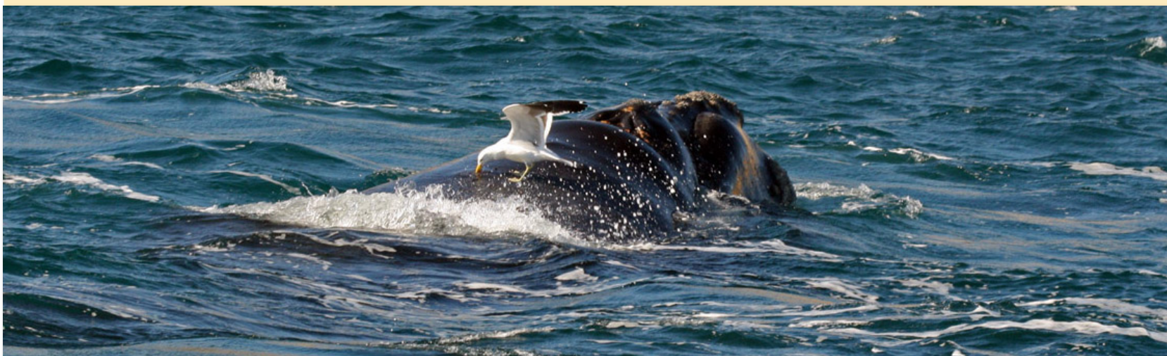
Una gaviota cocinera picotea el lomo de una ballena franca austral.

Alrededor de Puerto Madryn se han verificado basurales a cielo abierto, lo que permite que muchos animales tengan alimento disponible. Los ataques de gaviotas a las ballenas, que visitan estas aguas tranquilas para reproducirse, parecen haber aumentado afectando negativamente la calidad de vida de las ballenas en esta área de cría.