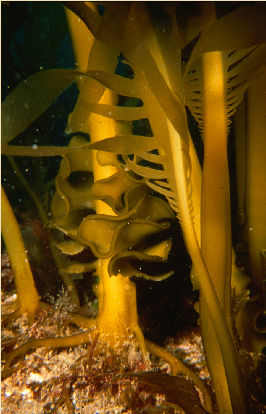
Alga Undaria pinnatifida .

A partir de 1992, un alga japonesa ( Undaria pinnatifida ) que fue accidentalmente traída por barcos pesqueros aparece en las costas de la Patagonia argentina causando problemas ambientales, sociales y económicos.