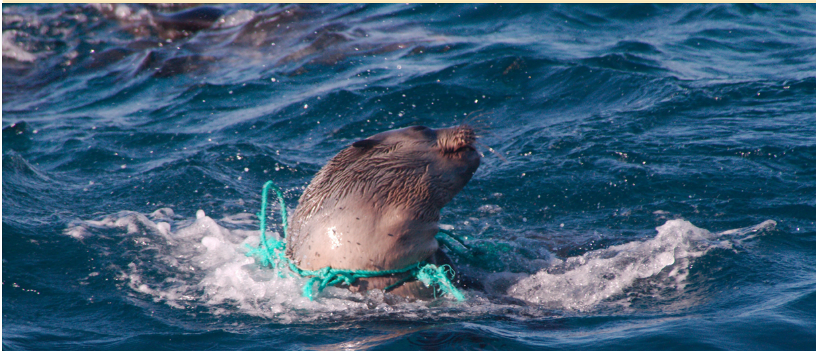
Lobo marino con un suncho de plástico alrededor.

El plástico es un material barato y liviano que tiene muchos usos. Los océanos están llenos de plásticos, el 80% de los residuos que encontramos en el mar son residuos terrestres y no marinos.