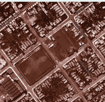
5 Canchas de Estudiantes de Buenos Aires y Liberal Argentino. Quevedo, J. P. Varela, Simbrón y Allende