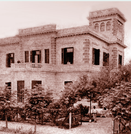
2 Palacio Dellacha. Av. Chivilcoy y Nueva York (esq. SE)

donde estaba ubicado fue loteada. Una torre, hoy reconocida como El Mirador (sobre la calle Mercedes al 3900, donde hoy se levanta el edificio de una heladería), era su tanque de agua surtido por un molino de viento ubicado en Enciso y Nueva York.