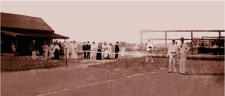
12 Villa Devoto Lawn Tennis Club. Pareja, entre Chivilcoy y Mercedes, vereda oeste

de teatro y proyecciones cinematográficas. También fue utilizado por organizaciones aliadas durante la Primera Guerra Mundial. Luego de terminada su última remodelación en 1938, desapareció y fue ocupado el lugar, en 1941, por el cine Arenales que a fines de la década sería Maryland y cerrará como tal en los años sesenta.