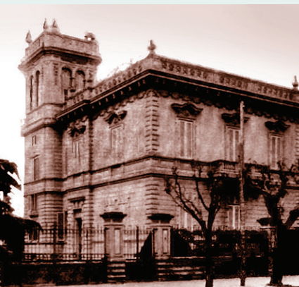
18 Mercado Gral. Arenales. Nueva York 3670