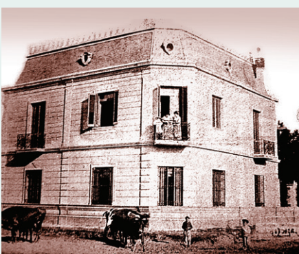
9 Conjunto Palacete de Federico Devoto, Palacio Ceci y Casa Chica de Federico Devoto. Av. Lincoln y Habana

Enfrentando la plazoleta Policía Federal (Habana, Av. Lincoln, y Gualeguaychú) perduran, cumpliendo funciones educacionales, dos palacetes que rememoran la vida de la alta clase social de la villa de comienzos del siglo XX. Uno, conocido como Palacio Ceci (Av. Lincoln 4305) forma parte de la Escuela de Educación Especial y Capacitación Laboral “Profesor Bartolomé Ayrolo”. El otro es la Academia de Cultura Inglesa (Av. Lincoln 4255), una casona propiedad de Federico Devoto, que era “casa de huéspedes” de su desaparecida quinta de verano. Dicha mansión estaba construida contra Habana y Gualeguaychú teniendo entrada por Pareja y Lincoln. Luego del fallecimiento de Federico Devoto, su esposa se estableció aquí, como antes algunas de sus hijas en “la Casa Chica”, de Lincoln y Habana. Ambas fueron vendidas durante la década del 1940.