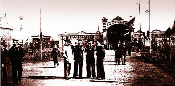
7 Sociedad Italiana de Tiro al Segno. Nueva York y Ricardo Gutiérrez