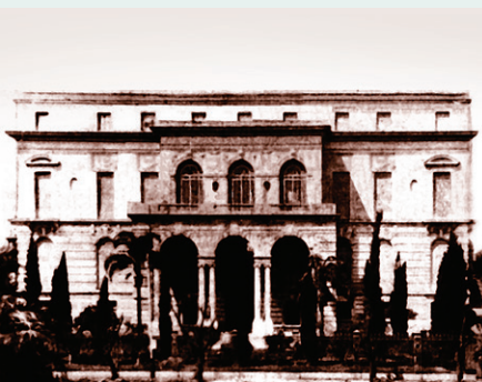
16 Palacio Devoto. Salvador M. del Carril, Joaquín V. González, Nueva York y San Nicolás