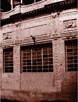
11 Operai Italiani y Cine Arenales. Chivilcoy 4508

Nacido Salón San Carlos poco antes de 1910, sirvió para fiestas y espectáculos de la colectividad británica. El Skyting Club usó la pista para patinaje, bailes con orquesta y proyecciones cinematográficas. Desaparecido el club, el lugar se convirtió en un baluarte cinematográfico del centro barrial. A comienzos de los años 30 sucumbió a exigencias del cine sonoro y pasó a ser sede social de la Sociedad de Socorros Mutuos de Villa Devoto, disuelta en 1934. Integrada al Dopo Laboro o Asociación Italiana Enrique Toti compartió ámbito con el Tiro al Segno. Perduró con esta última, disuelta la anterior, hasta su desafectación en la década de 1980.