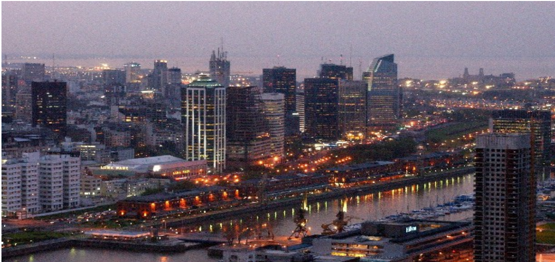
Puerto Madero – Buenos Aires 2006