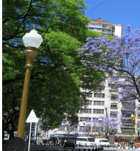
Plaza «seca» junto a Plaza San Martín - Retiro