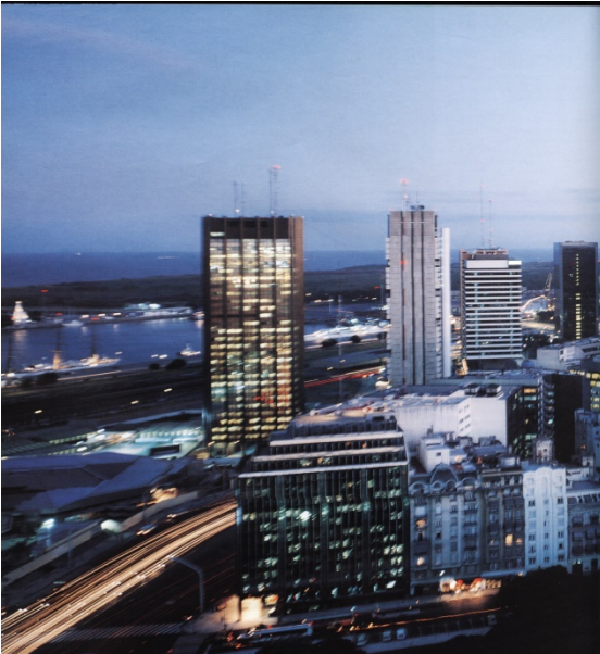
Buenos Aires 2000