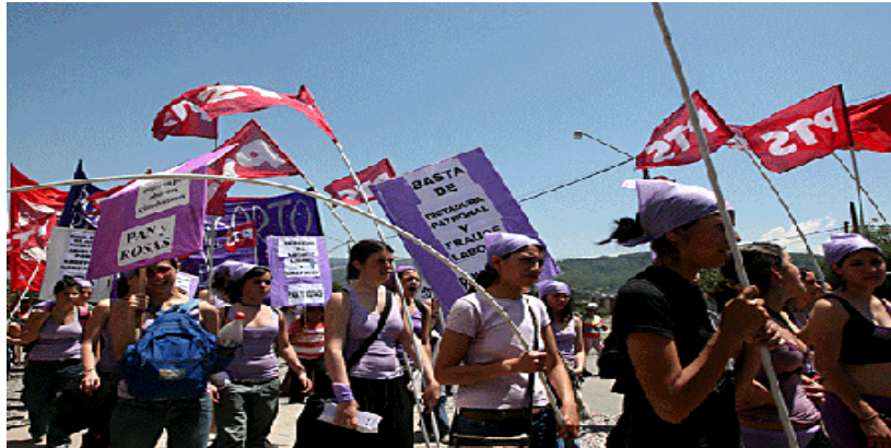
Encuentro Nacional de Mujeres, en Jujuy