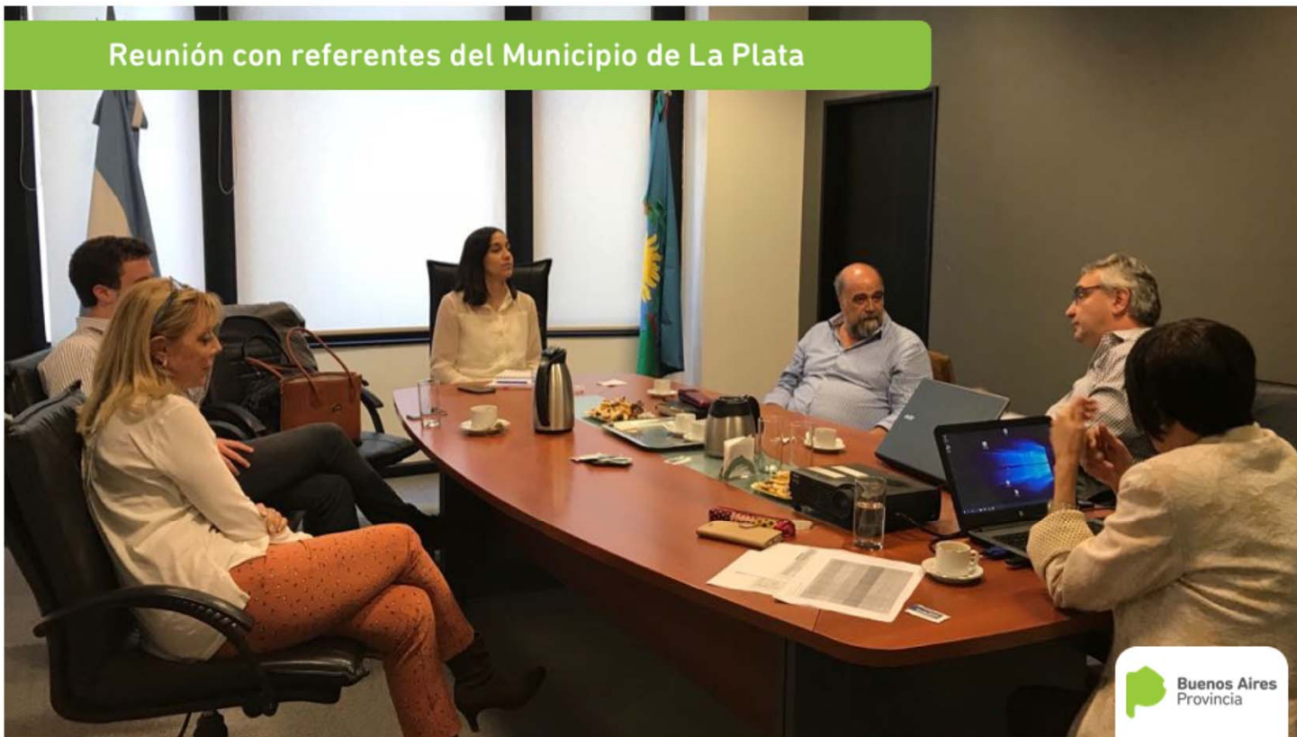
Reunión con referentes del Municipio de La Plata