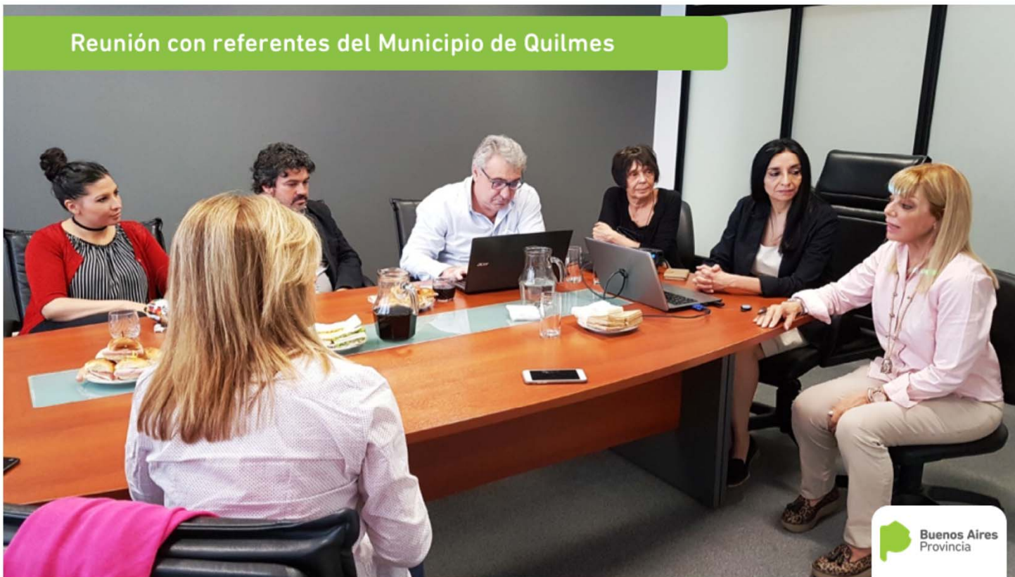
Reunión con referentes del Municipio de Quilmes