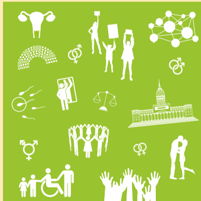
Educación Sexual Integral