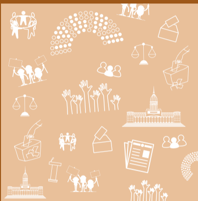
Formación Ética y Ciudadana