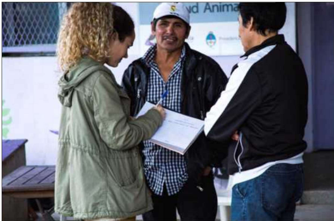
Sector San Martín