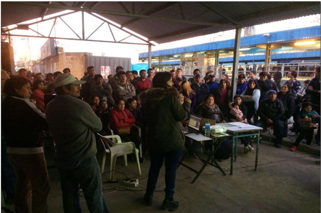
Sector San Martín, Veterinaria (ex Salita) - Calle 14