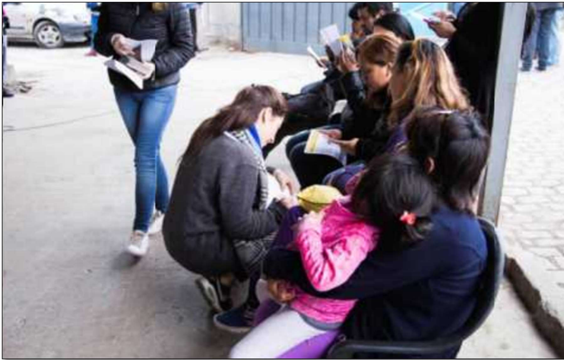
Sector San Martín