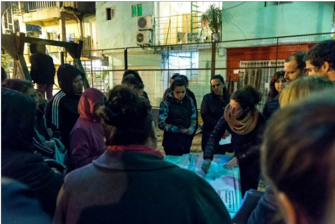
Plaza del Cartel, sector Güemes-YPF