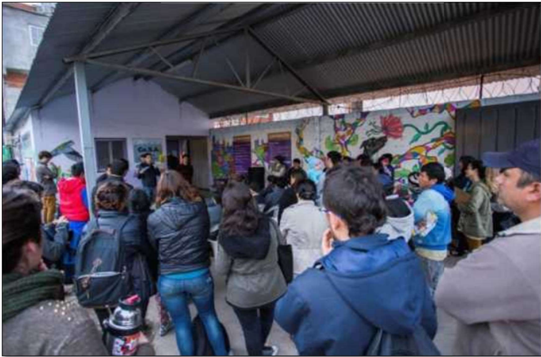
Sector San Martín