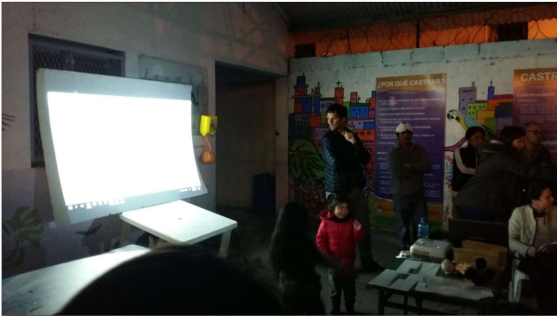
Sector San Martín, Veterinaria (ex Salita) - Calle 14