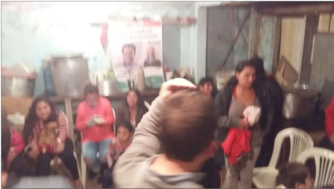
Comedor San Nicolás, sector Ferroviario