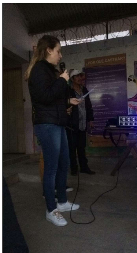
Sector San Martín