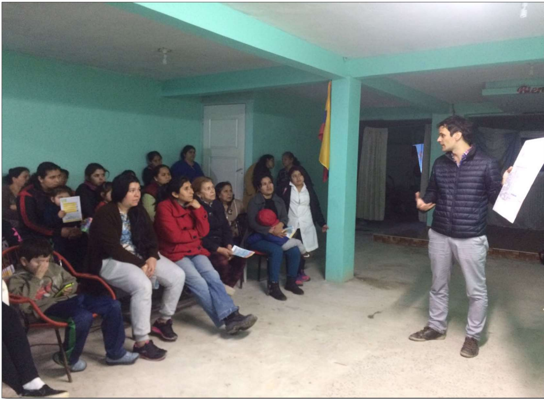
Iglesia Evangélica “León de Judá”, sector Playón Este