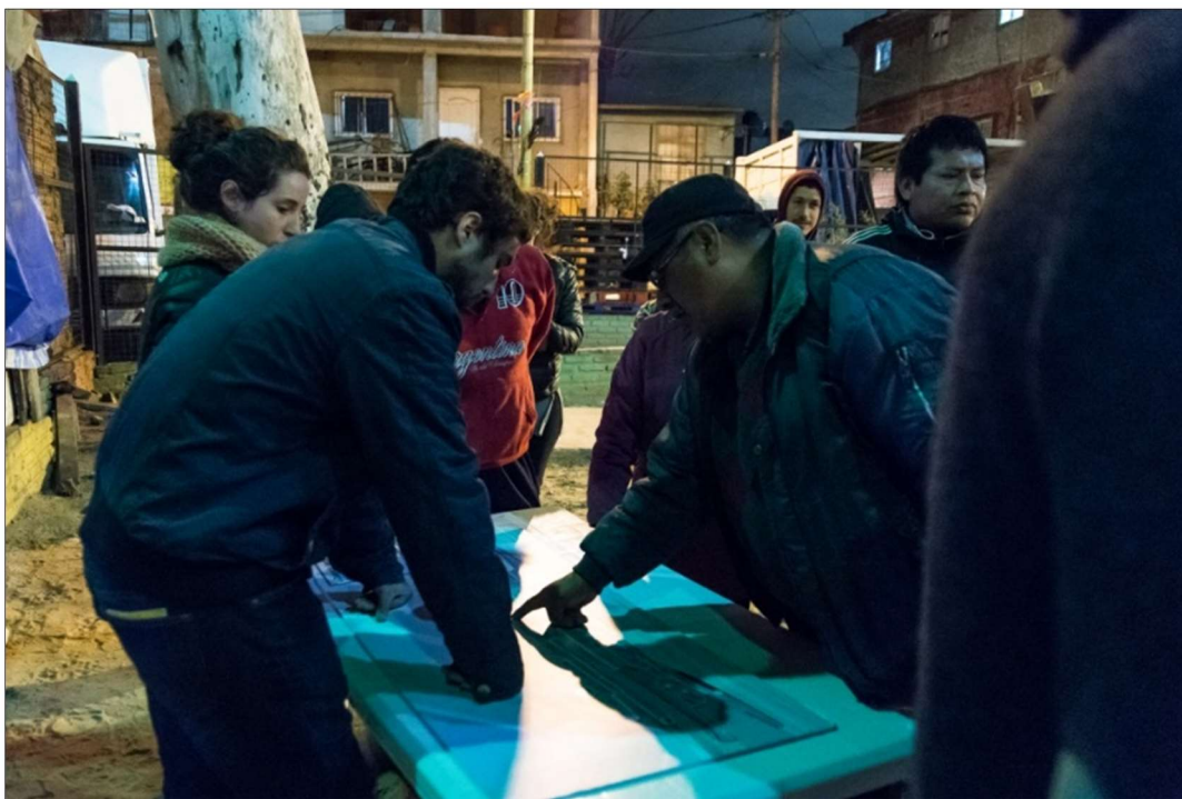
Plaza del Cartel, sector Güemes-YPF