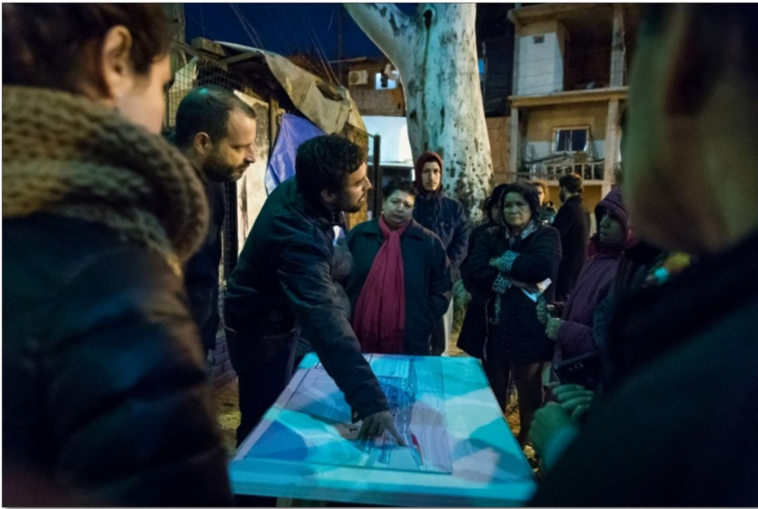
Plaza del Cartel, sector Güemes-YPF