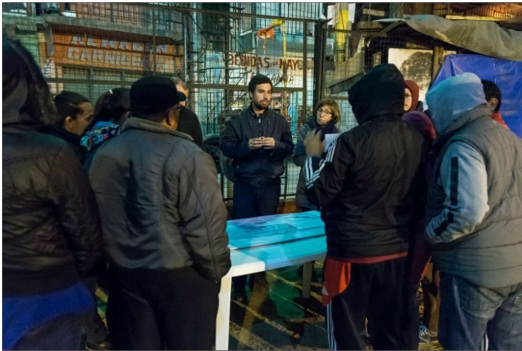
Plaza del Cartel, sector Güemes-YPF