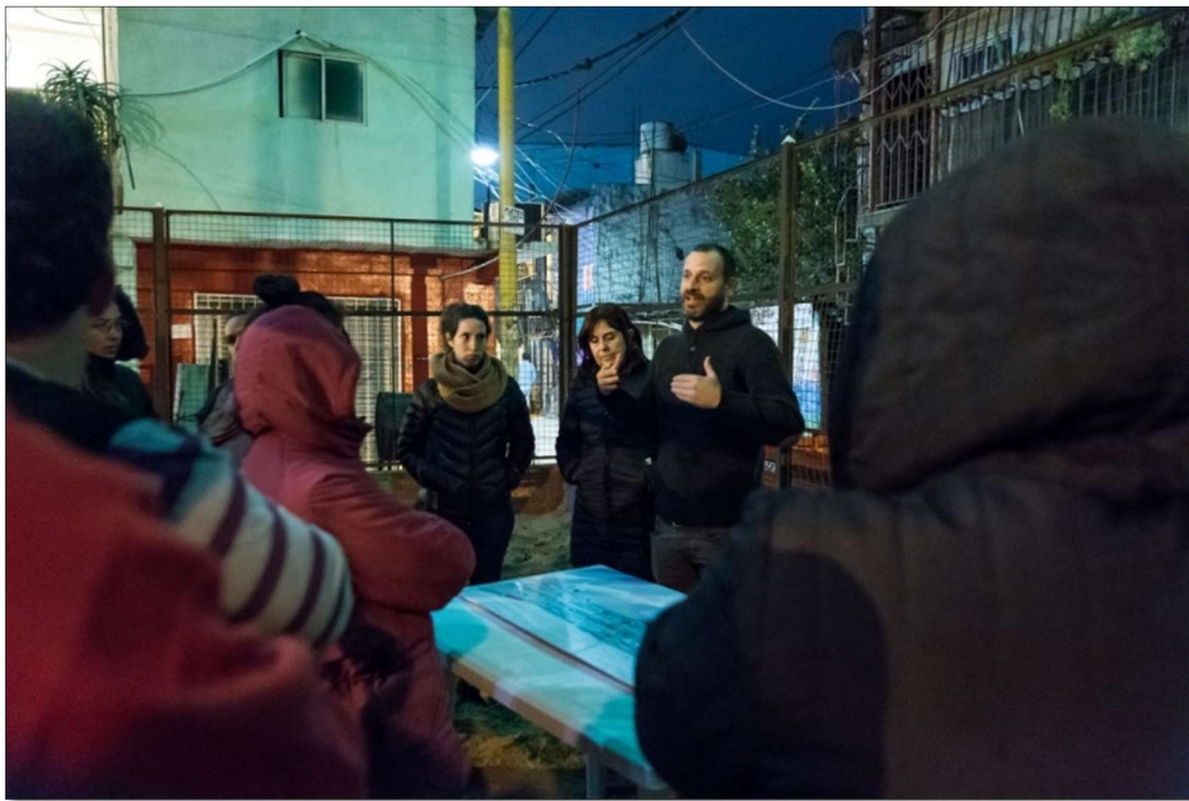
Plaza del Cartel, sector Güemes-YPF