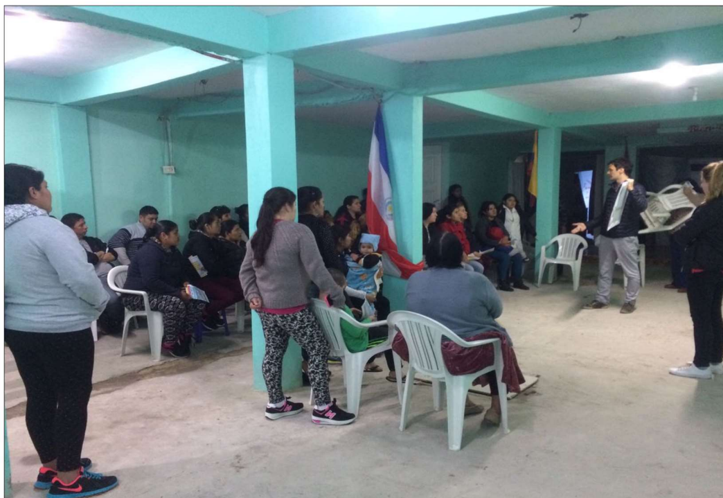
Iglesia Evangélica “León de Judá”, sector Playón Este