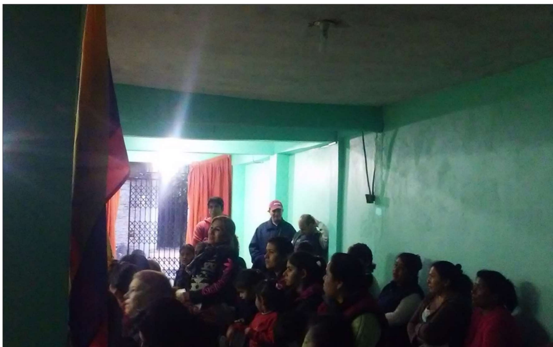
Iglesia Evangélica “León de Judá”, sector Playón Este