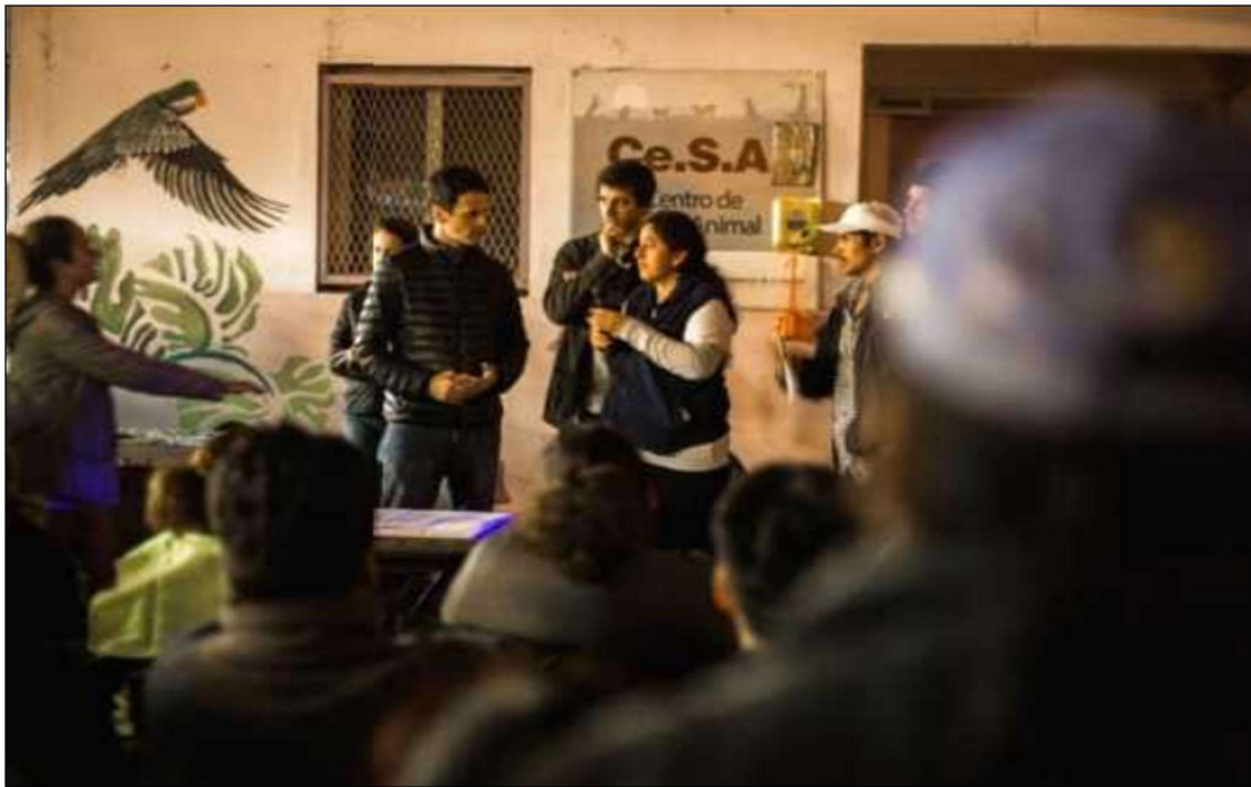
Sector San Martín