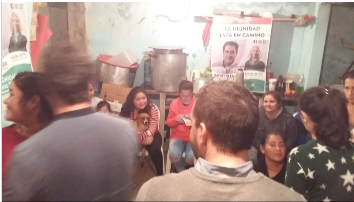
Comedor San Nicolás, sector Ferroviario

Se realizó un registro audiovisual de las distintas reuniones realizadas.