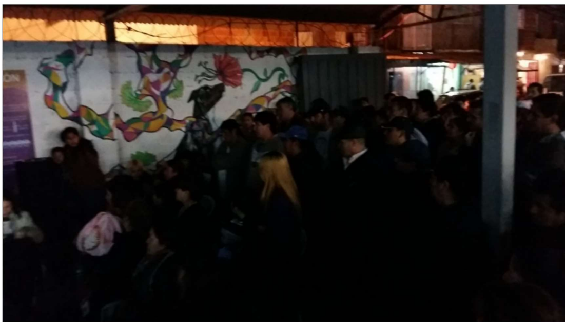
Sector San Martín, Veterinaria (ex Salita) - Calle 14