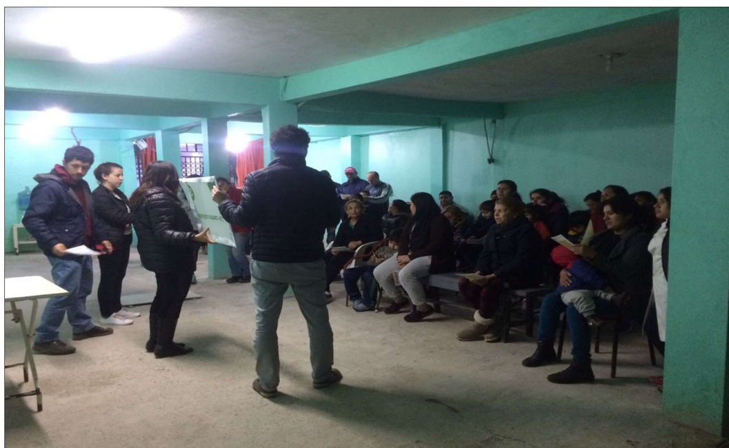
Iglesia Evangélica “León de Judá”, sector Playón Este