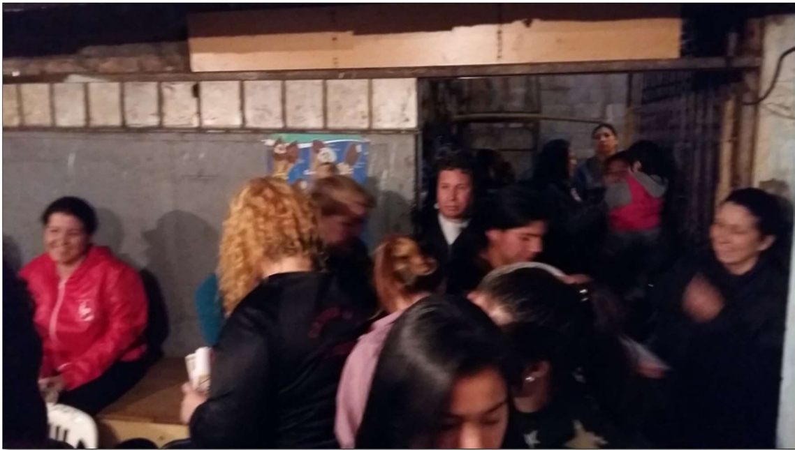
Comedor San Nicolás, sector Ferroviario