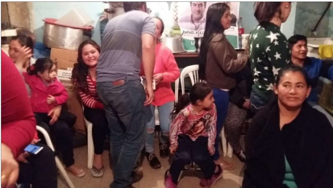
Comedor San Nicolás, sector Ferroviario