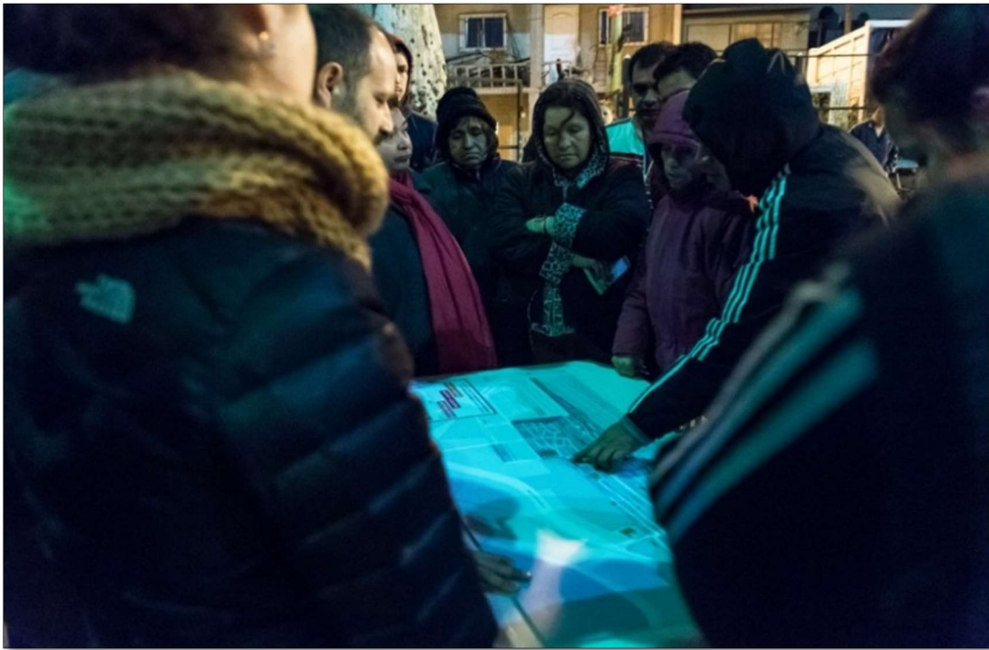
Plaza del Cartel, sector Güemes-YPF