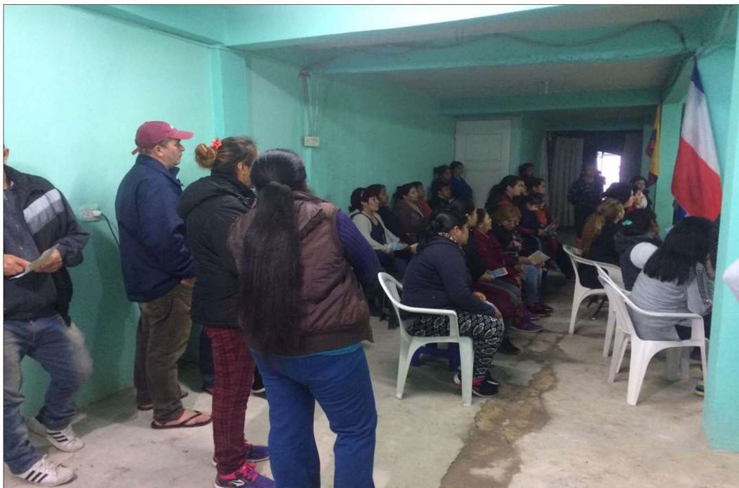
Iglesia Evangélica “León de Judá”, sector Playón Este