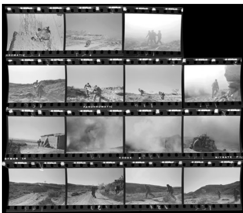
imagen y el personaje u objeto que aparece dentro. La elección de los distintos planos tiene objetivos expresivos y narrativos diferentes. Podemos decir que mientras los planos generales nos permitirían mostrar al personaje en relación con el contexto que lo rodea y ofrecerían información acerca del lugar donde se desarrolla la acción, los primeros planos nos servirían para cargar de dramatismo, resaltarían determinadas expresiones de los personajes o remarcarían algún detalle de los objetos.

Los planos nos indican la relación de tamaño que se da entre el cuadro de la