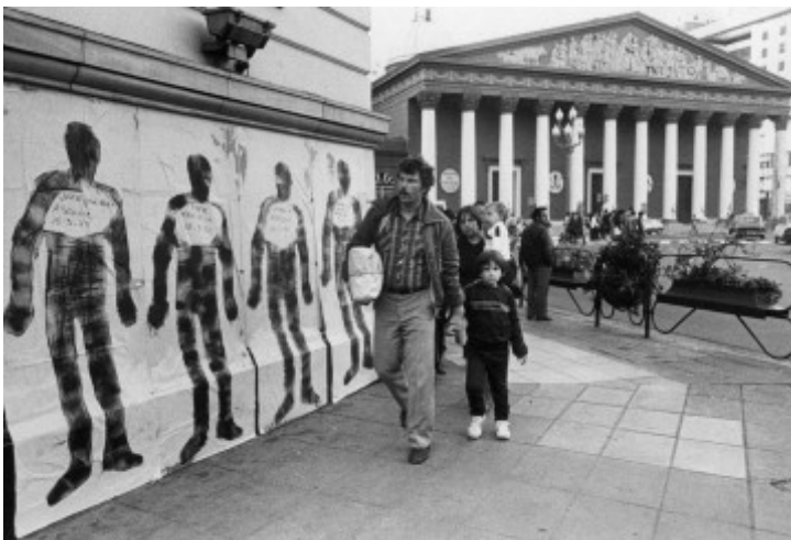
El Siluetazo. Septiembre de 1983.

Al igual que ocurre con otras efemérides, el tratamiento de los acontecimientos que las mismas evocan pueden constituirse en un mero ritual o, por el contrario, ser una oportunidad para el ejercicio de la memoria. Sabemos que la interpretación del pasado siempre está sujeta a controversias y que distintos grupos sociales participan en disputas simbólicas por la memoria. El espacio de la escuela es uno de los espacios privilegiados para reflexionar sobre ese período. Por tratarse de acontecimientos considerados como una de las experiencias más traumáticas de nuestra historia reciente, el tratamiento escolar de los mismos deviene en invitación para pensarnos como comunidad no solo en clave de pasado, sino también de presente y futuro.