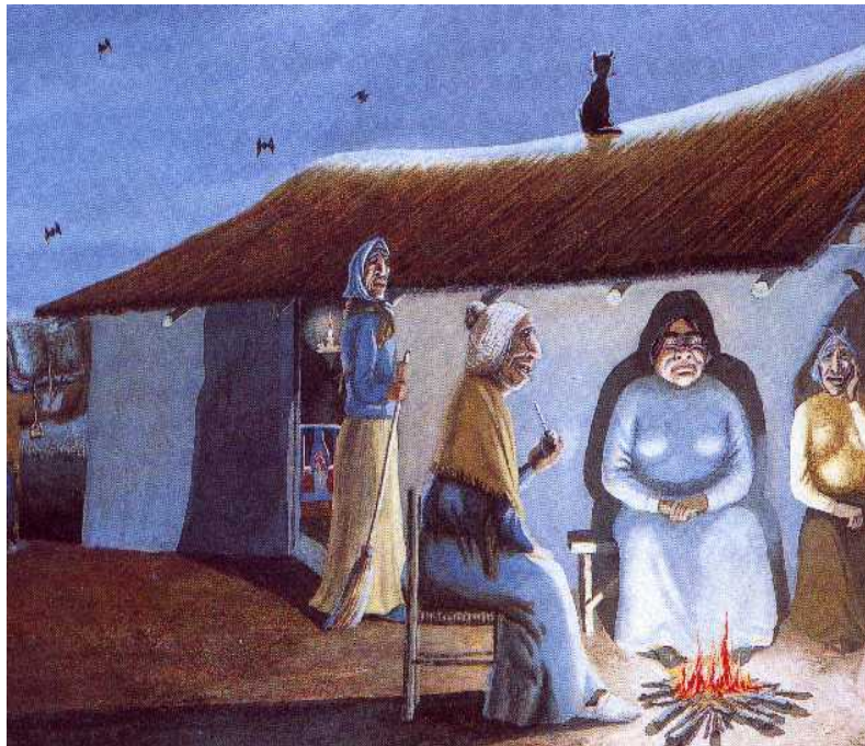
Chismosas. Florencio Molina Campos

Al analizar las imágenes los niños observarán en detalle la información que las mismas brindan: las características del paisaje pampeano y de las viviendas, los objetos de la vida cotidiana, los modos de obtener energía, entre otras.