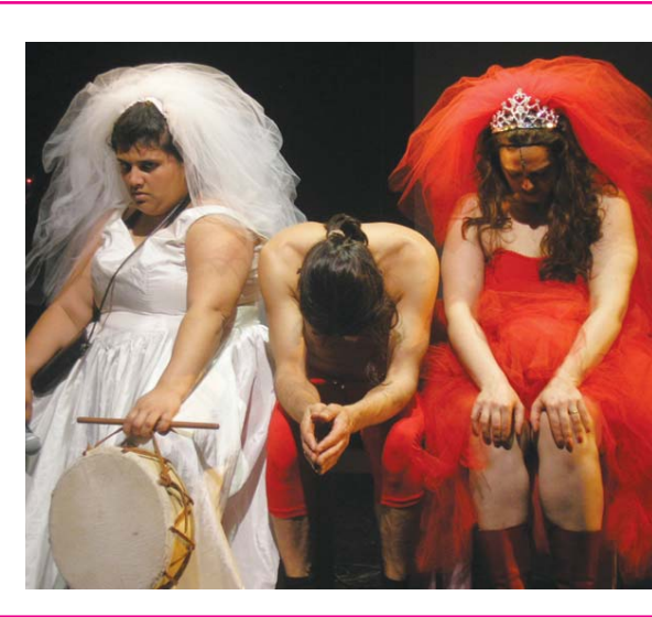
Fotografía de un momento de la Temporada Verano 09.

salas con guión adaptado. El paseo finaliza con una mesa didáctica. PINTANDO A PERLOTTI. Basándose en la visita guiada, los chicos ilustrarán las obras que le llamaron más la atención. Se invitará a los chicos a colorear imágenes de relieves destacados del artista. Materiales: papel y crayón. Ideal chicos 6 a 10 años. Arte Efímero: en la sala de taller se ubicarán bateas con arena para que jueguen creando. Sábado, 11 a 12.30 hs. TALLER NIÑOS ESCULTORES. El objetivo del taller es dar a conocer los procedimientos básicos de la técnica escultórica tradicional (modelado en arcilla). Actividad programada para chicos de 8 a 12 años. El Museo proporcionará el material y las herramientas. VISITAS GUIADAS PROGRAMADAS. Para grupos de 5 a 15 personas (adultos y/o chicos). Actividades con inscripción previa. Informes e inscripción al 4433-3396, de lunes a viernes de 9 a 18 hs. MUSEO DE LA CIUDAD Defensa 219. 4343-2123. Lunes a viernes, 11 a 19 hs. Sábados, domingos y feriados, 15 a 19 hs. LOS PORTEÑOS VUELVEN A JUGAR CON LOS JUGUETES DE AYER. Exposi-