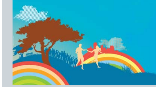
Ilustración de un momento de la Temporada Verano 09.

Siempre fue en contra de los clichés del canto flamenco, al que supo vincular con otras artes y nutrir con recursos diversos. Es reconocido como uno de los máximos responsables de la renovación del cante, así como el mejor adaptador al flamenco de poemas cultos de poetas como Miguel Hernández, García Lorca, los Machado, Lope de Vega, Alberti. Acaso por eso pueda decirse que Enrique Morente (Granada, 1943), además de un artista con mayúsculas, es un artista audaz, fiel a la esencia del flamenco, pero no necesariamente a todos sus convencionalismos.