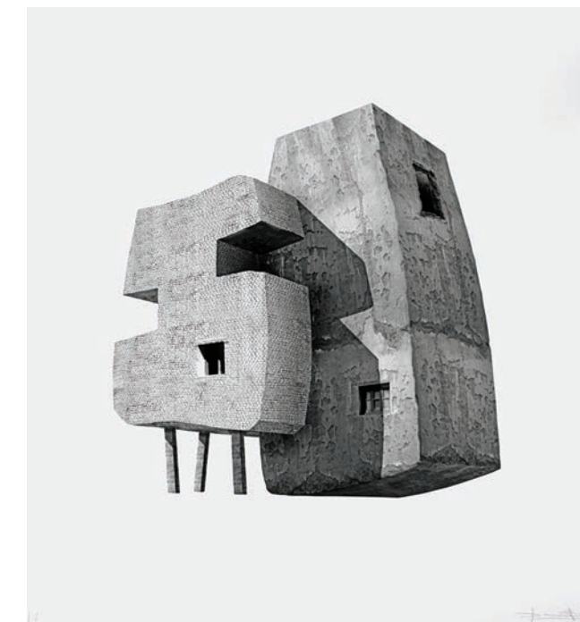
2º MENCIÓN GERÓNIMO SALVATIERRA PEQUEÑA ESTRUCTURA 5