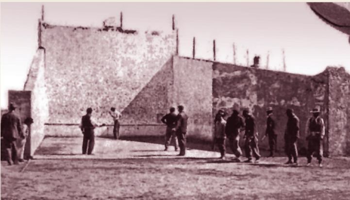
2 Casa de Remates La Granja Nacional. Av. Rivadavia 9854.

El apeadero Villa Luro del F.C. del Oeste (hoy Sarmiento) quedó inaugurado el 1° de diciembre de 1911 en las actuales Irigoyen y Cortina. Llevó ese nombre en honor a Pedro O. Luro, quien donara los terrenos para su construcción. La estación actual (Yerbal entre Molière y Virgilio) fue inaugurada en 1928. Pedro Luro fue médico, hacendado, director del Banco de la Provincia de Buenos Aires y diputado nacional entre 1898 y 1912.