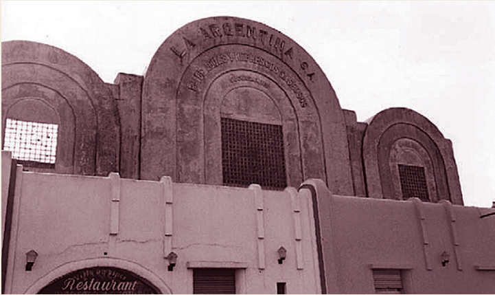
8 Ex Depósito Fábrica de Sodas La Argentina. Araujo 546.

manzanas) y dueño del Bazar Penco. Con el paso del tiempo el predio fue adquirido por José “Don Pepe” Amalfitani (1894-1969), el mítico presidente del Club Atlético Vélez Sársfield, que vivió en el chalet, remodelado. Aunque con nuevas refacciones, todavía se mantiene en pie ocupado por los herederos de Don Pepe.