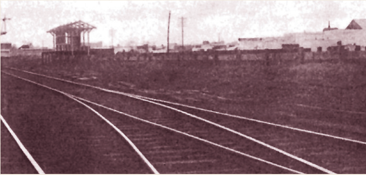
1 Antigua Estación Villa Luro. Irigoyen y Cortina

El apeadero Villa Luro del F.C. del Oeste (hoy Sarmiento) quedó inaugurado el 1° de diciembre de 1911 en las actuales Irigoyen y Cortina. Llevó ese nombre en honor a Pedro O. Luro, quien donara los terrenos para su construcción. La estación actual (Yerbal entre Molière y Virgilio) fue inaugurada en 1928. Pedro Luro fue médico, hacendado, director del Banco de la Provincia de Buenos Aires y diputado nacional entre 1898 y 1912.