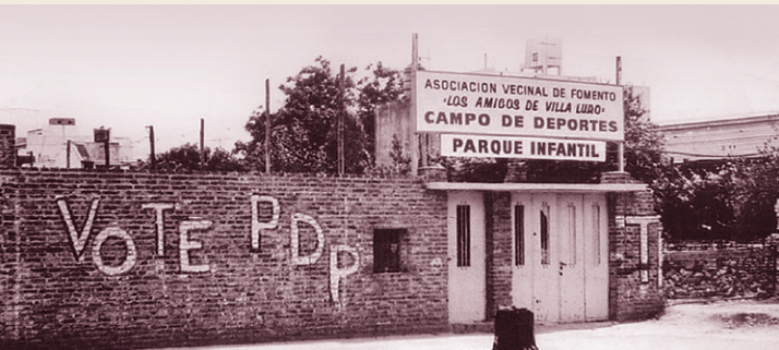
5 Ubicación original de la Asociación Vecinal “Los Amigos de Villa Luro”. Av. Rivadavia 10110.

Este chalet fue una emblemática construcción del barrio, de gran jerarquía. Fue construido en la década de 1920 y posteriormente demolido. El lugar hoy es ocupado por un garaje.