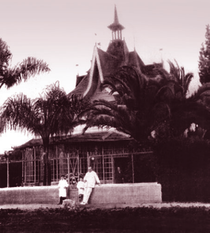
4 Chalet de Prandi. Guardia Nacional 271.

Este chalet fue una emblemática construcción del barrio, de gran jerarquía. Fue construido en la década de 1920 y posteriormente demolido. El lugar hoy es ocupado por un garaje.