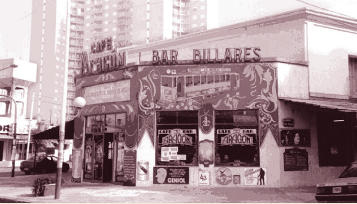
11 Bar Aragón. Av. Juan B. Alberdi 4899.