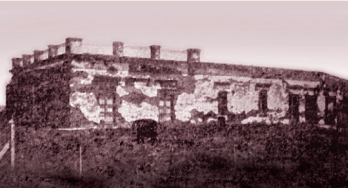
17 Quinta de los Virreyes. San Blas, Molière, Camarones y Virgilio.

El 14 de mayo de 1703 el capitán Pedro Fernández de Castro y Velazco compró unas tierras al oeste de la ciudad. Falleció unos meses después, el 18 de julio, quedando esa propiedad en manos de su hija. En 1781 la chacra fue comprada por Juan Pedro de Córdoba, quien recibiera del Virrey el título de Estaquero de Monte Castro. En esa casa (ubicada en la manzana hoy limitada por las calles San Blas, Molière, Camarones y Virgilio) fue donde pernoctó el Virrey Sobremonte antes de marchar a Córdoba durante la invasión británica de 1806, cosa que motivó que fuera conocida con el nombre de “Casa de los Virreyes”. También en 1810 pararon allí Antonio González Balcarce y Francisco de Ortiz de Ocampo, cuando organizaron el Ejército del Norte que debía partir a la campaña del Alto Perú. La quinta fue rematada en 1911 y la casa finalmente demolida hacia 1940.