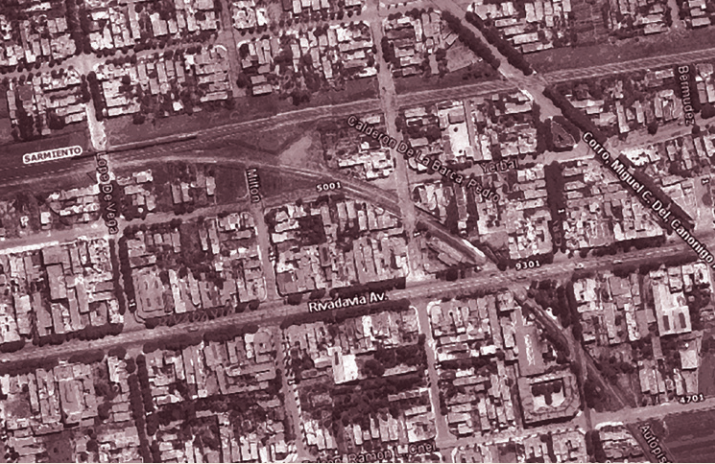
15 Ramal F.C. del Oeste y Av. Perito Moreno. Autopista Perito Moreno.

La actual avenida y autopista Perito Moreno fue durante muchos años un ramal de cargas del Ferrocarril Oeste (hoy Sarmiento). Fue habilitado el 14 de septiembre de 1895 en reemplazo del denominado “Tren de las Basuras”, que corría entre Once y la quema de basuras de Parque Patricios. Se mantuvo activo hasta el 16 de octubre de 1951, año en que fue clausurado y en su lugar se trazó la avenida Del Justicialismo (desde 1955 avenida Perito Moreno). En tiempos de la última dictadura militar se trazó sobre parte de su recorrido (desde la Av. Dellepiane hasta la Av. General Paz) la Autopista Perito Moreno, que fue inaugurada el 6 de diciembre de 1980 junto con la Autopista 25 de Mayo. Para poder construir estas vías fue necesario expropiar más de 3.000 viviendas, dejando sin hogar a 150.000 personas.