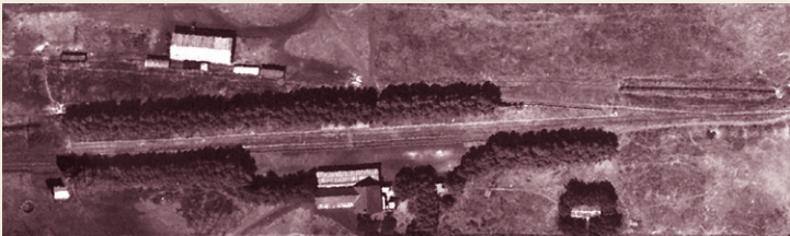
19 Ramal F.C. al Pacífico. Ruiz de los Llanos e Irigoyen.