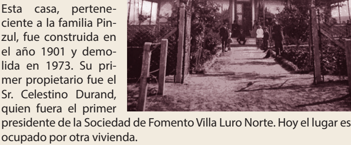
18 Casa Pinzul. Víctor Hugo 1056.