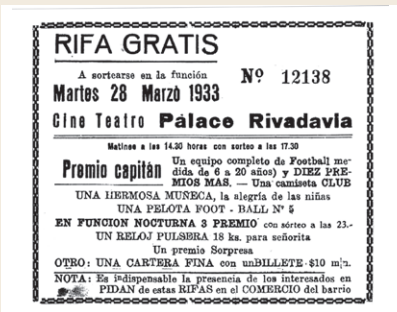
13 Cine Palace Rivadavia. Av. Rivadavia 9654

Este cine, originalmente llamado Bernardino Rivadavia, fue inaugurado en 1924 por la Compañía Paoli Mignone con una superficie de 1.000 m2. Al ser remodelado en 1957 se le dio el nombre de Cine-Teatro Palace Avenida Rivadavia. Fue destruido por un incendio el 22 de febrero de 1958. Posteriormente, fue demolido y en su lugar hoy se levanta un supermercado.