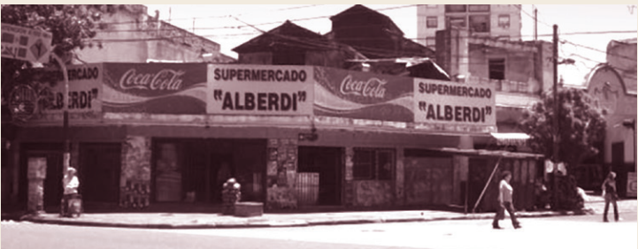
12 Mercado Homero. Av. Juan B. Alberdi 4801.