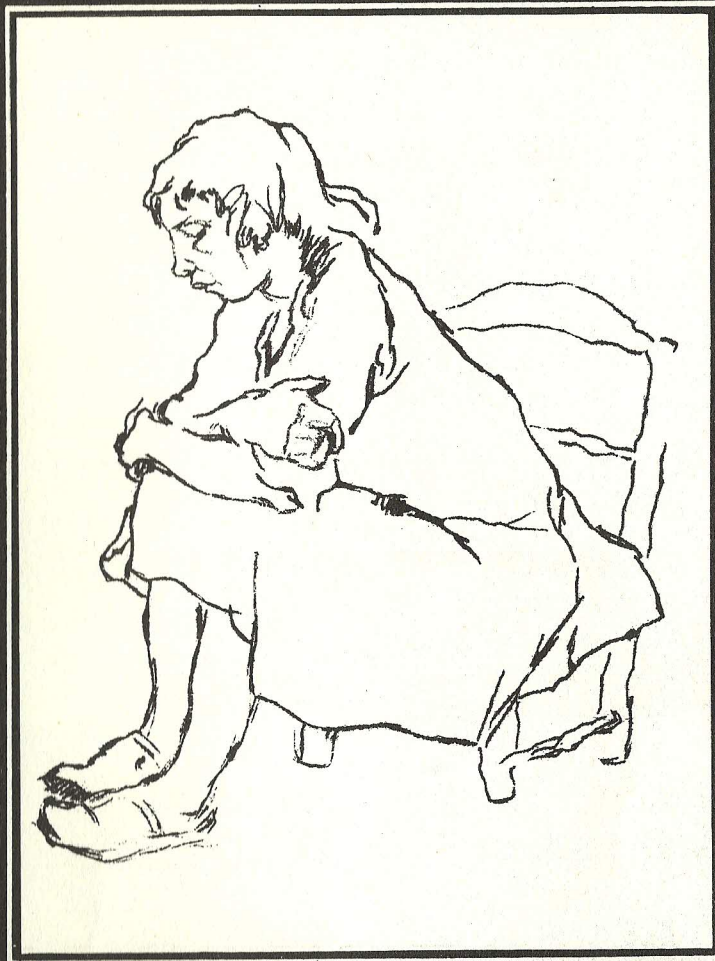
CHICA SENTADA, Litografía GUILLERMO FACIO HEBEQUER