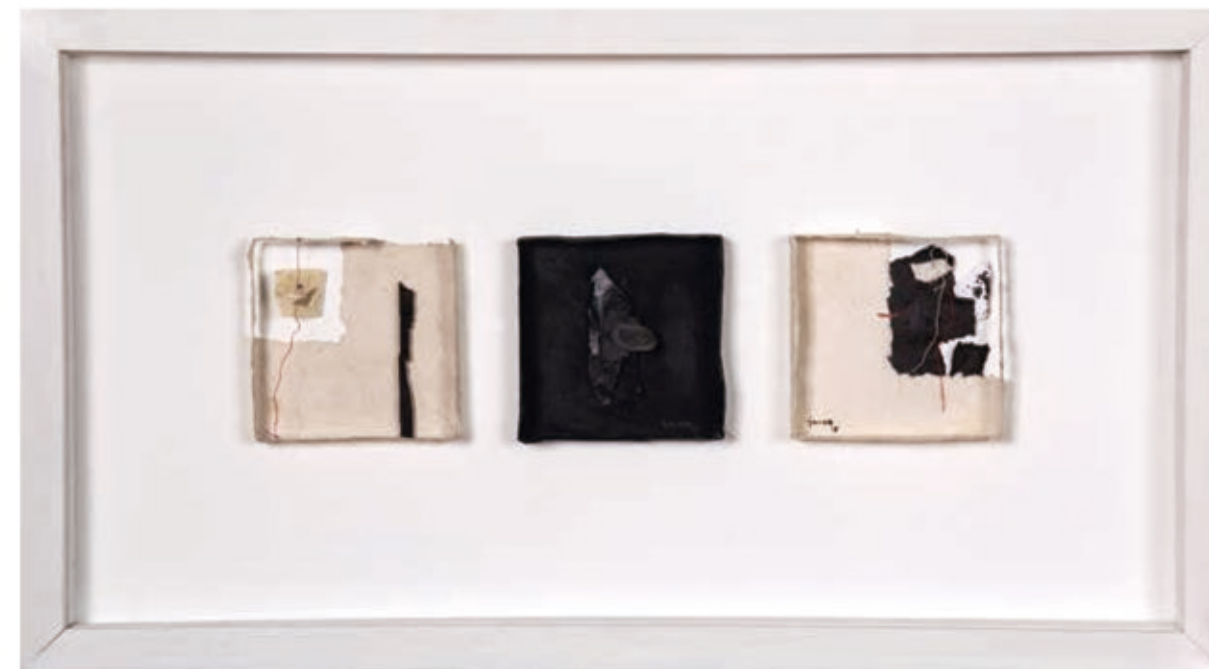
serie OCÉANOS DE PAPEL. técnica mixta. 33 x 59 x 3 cm. año 2015.