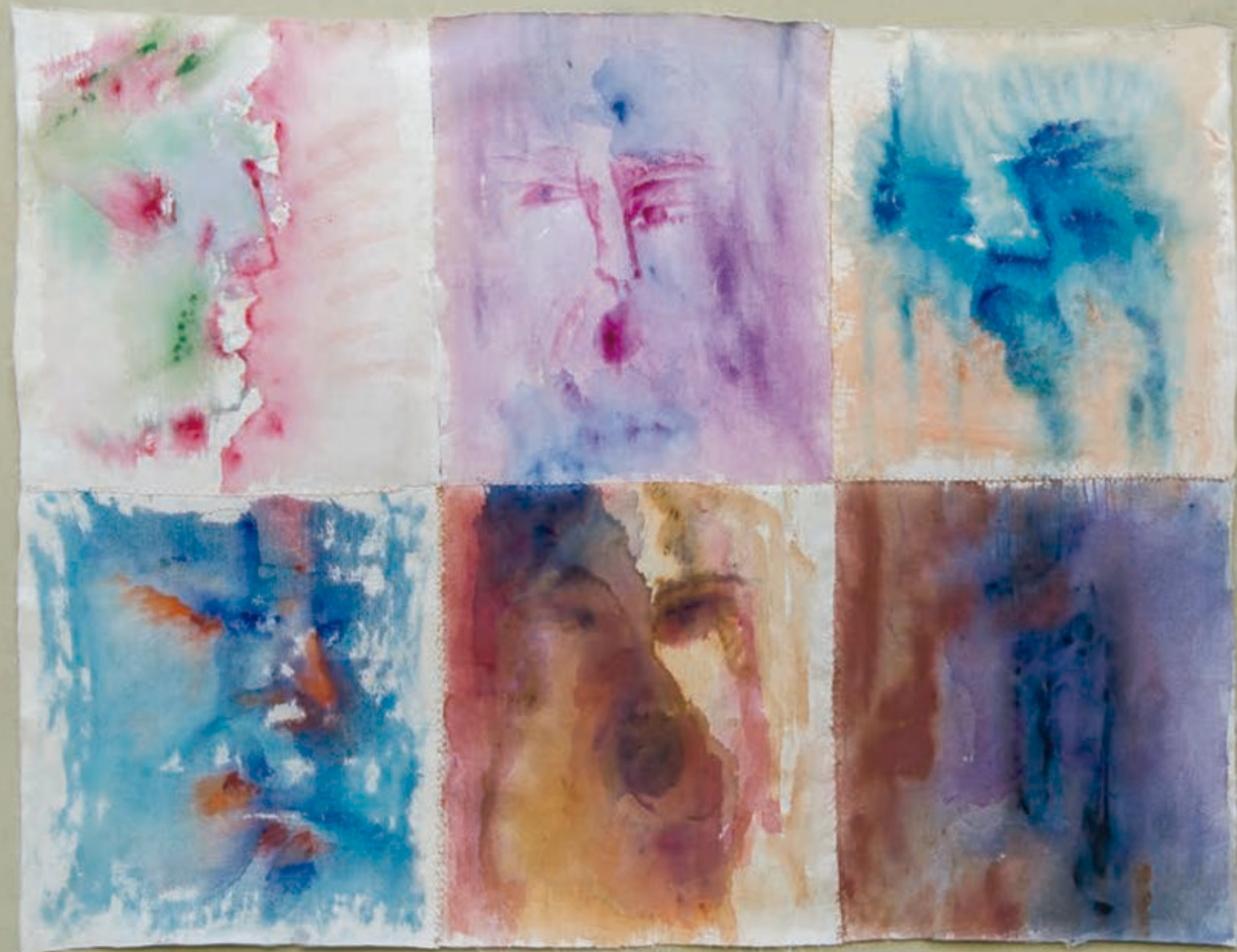
SIN TÍTULO , de la serie “VOCES”. lienzo s/marco, acrílico, acuarela, pastel, hilo. 150 x 100 cm. año 2015.