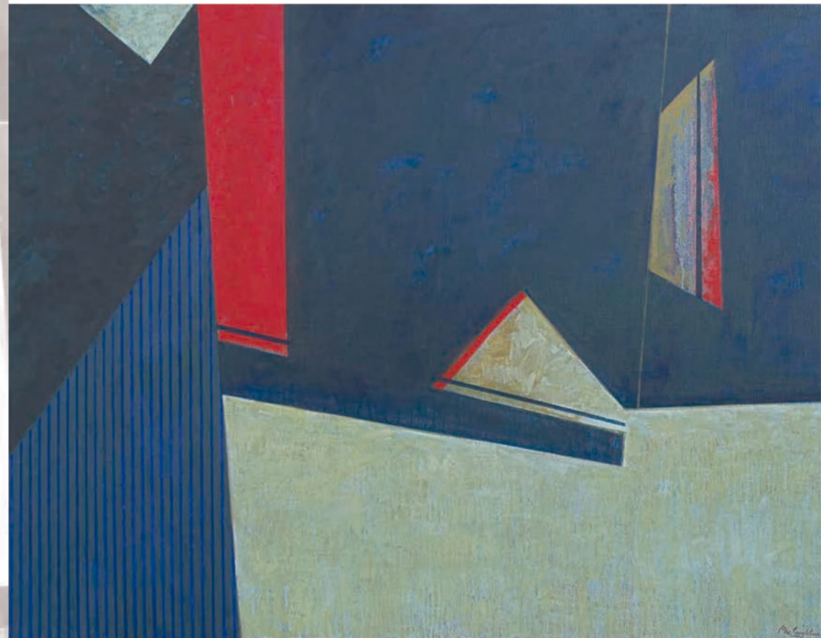
MASA CRÍTICA. óleo sobre tela. 115 x 150 cm. año 2015.

www.gmacloughlin.com.ar arteriberasur@yahoo.com.ar