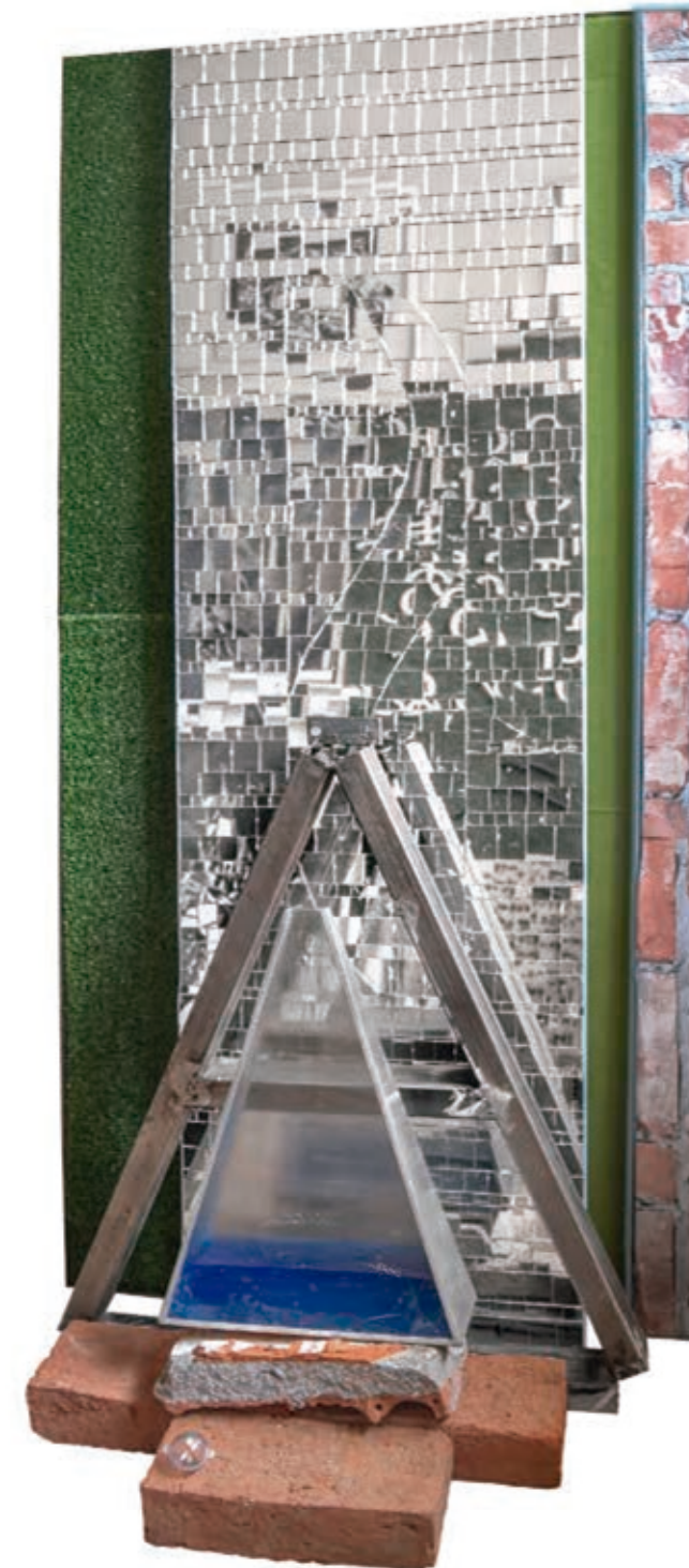
EL VIAJE II. fragmento, instalación. metal, ladrillo, acrílico, espejo. dimensiones variables. año 2015.

aliciakeshishian@gmail.com http://artebus.com.ar/akeshishian