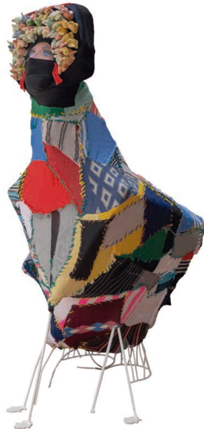
LA MUDA. cerámica, hierro y textil. 140 x 70 x 110 cm. año 2015.