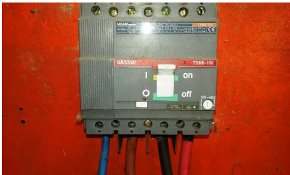
TM COMPACTA SASSIM 4 X 160 A – GIMNASIO 1

A la salida de la cámara transformadora se encuentra un tablero de distribución exterior en condiciones precarias. El mismo no cumple con las exigencias mínimas de seguridad ni de estanqueidad. De este parten circuitos de iluminación del sector, una línea de alimentación al gimnasio 1 y dos líneas que alimentan al gimnasio 2 (canchas de tenis cubiertas).