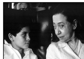
Divulgação Em cena de "Central do Brasil", de 1998, com Fernanda Montenegro