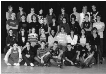
CLASSE PAGE 11 LYCEE TOULOUSE LAUTREC Toulouse PAGE 101.006 02/11/2014