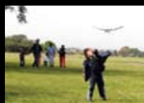
Foto de tapa: Más de 400 alumnos y sus familias participaron del certamen de aeromodelismo escolar.

Redacción: Av. Paseo Colón 255, 9.º piso. Tel.: 4339.7727/29/31 plural@buenosaires.gov.ar