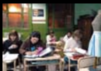
Foto de tapa: Curso de Corte y Confección en la Escuela N.º 16 D.E. 3, de la Dirección del Adulto y el Adolescente. Autora: Sol Beylis.

Redacción: Curso de Corte y Confección en la Escuela N.º 16 D.E. 3, de la Dirección del Adulto y el Adolescente. Autora: Sol Beylis.