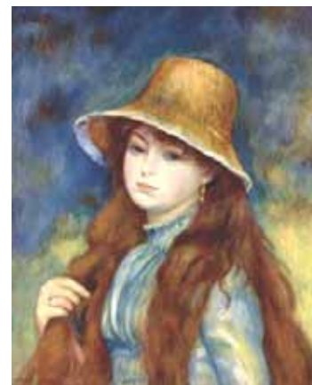
Renoir — Jeune fille au chapeau de paille — 1884

Para ello, los estimulamos colocando en la sala distintas obras de arte, algunas pegadas en el techo, otras en la pared, en tarjetones, y como libros de cuentos.