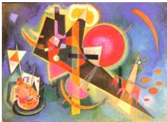
Wassily Kandinsky - In the Blue — 1925

"Si deseamos que los niños crezcan activos, curiosos y sin miedos, debemos brindarles un ambiente a la vez seguro y estimulante" (Pulaski, 1989).