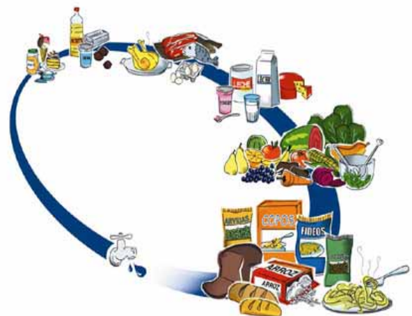
Esquema de la alimentación saludable

Una mala alimentación hipoteca el futuro de nuestros hijos