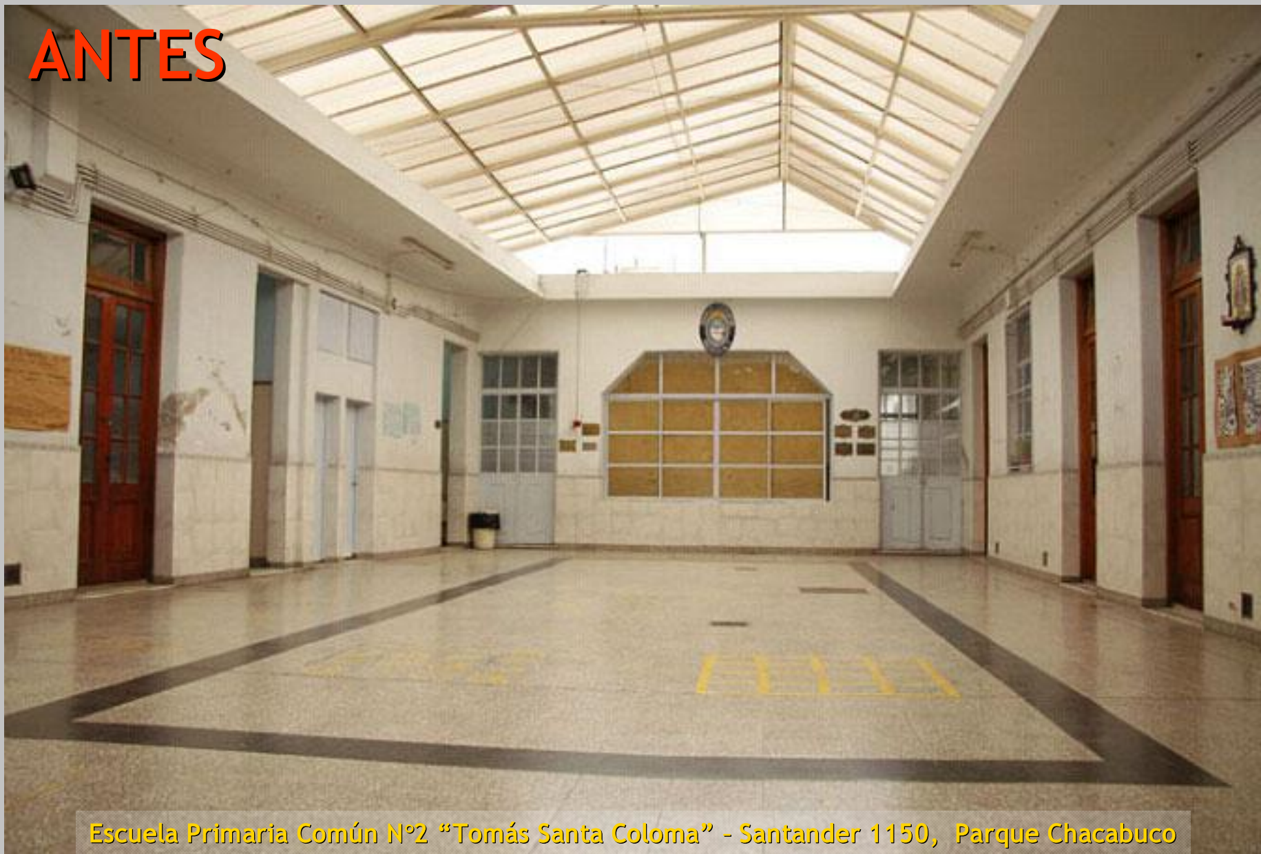
Escuela Primaria Común N°2 "Tomás Santa Coloma" - Santander 1150, Parque Chacabuco