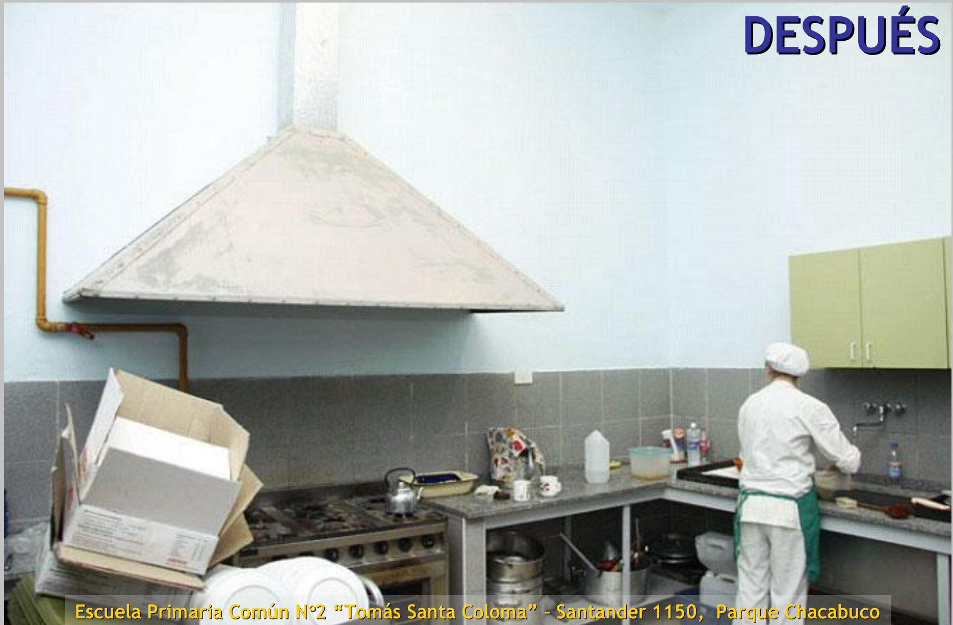
Escuela Primaria Común N°2 "Tomás Santa Coloma" - Santander 1150, Parque Chacabuco