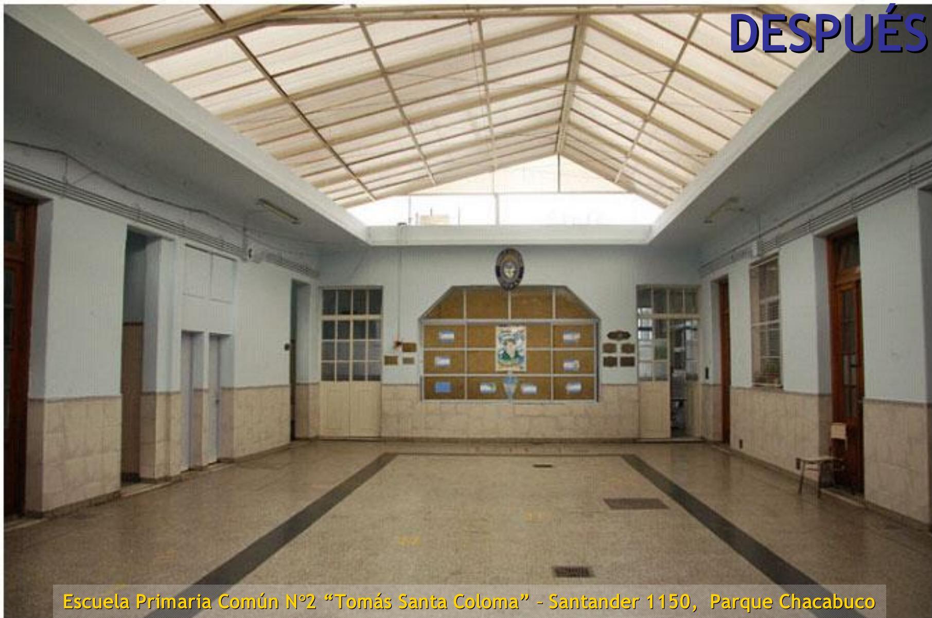
Escuela Primaria Común N°2 "Tomás Santa Coloma" - Santander 1150, Parque Chacabuco