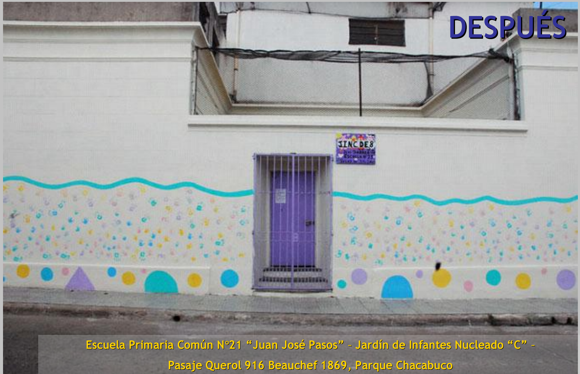
Escuela Primaria Común N°21 "Juan José Pasos" - Jardín de Infantes Nucleado "C" - Pasaje Querol 916 Beauchef 1869, Parque Chacabuco