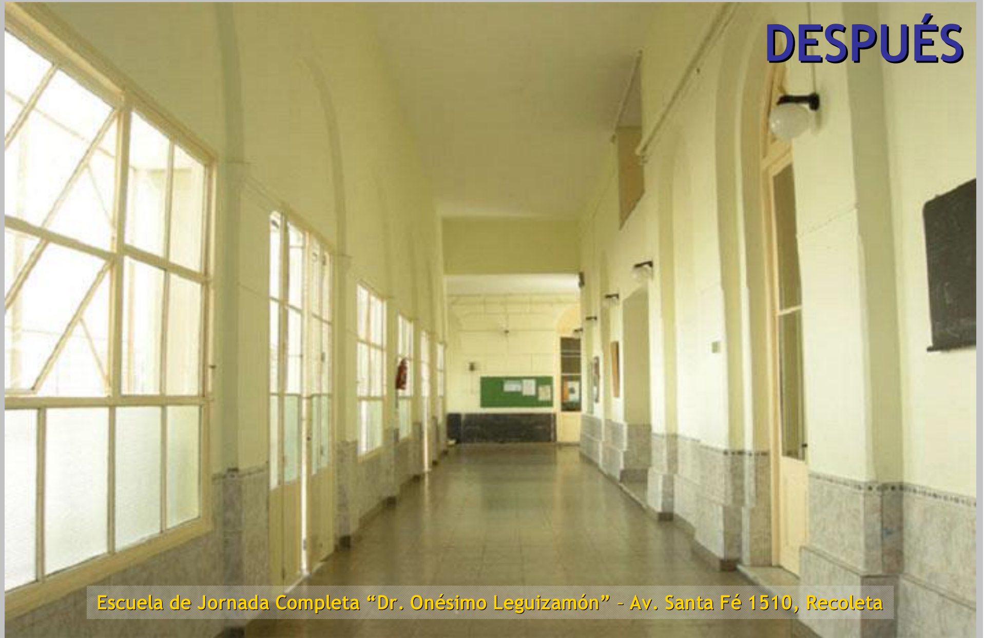
Escuela de Jornada Completa “Dr. Onésimo Leguizamón” - Av. Santa Fé 1510, Recoleta