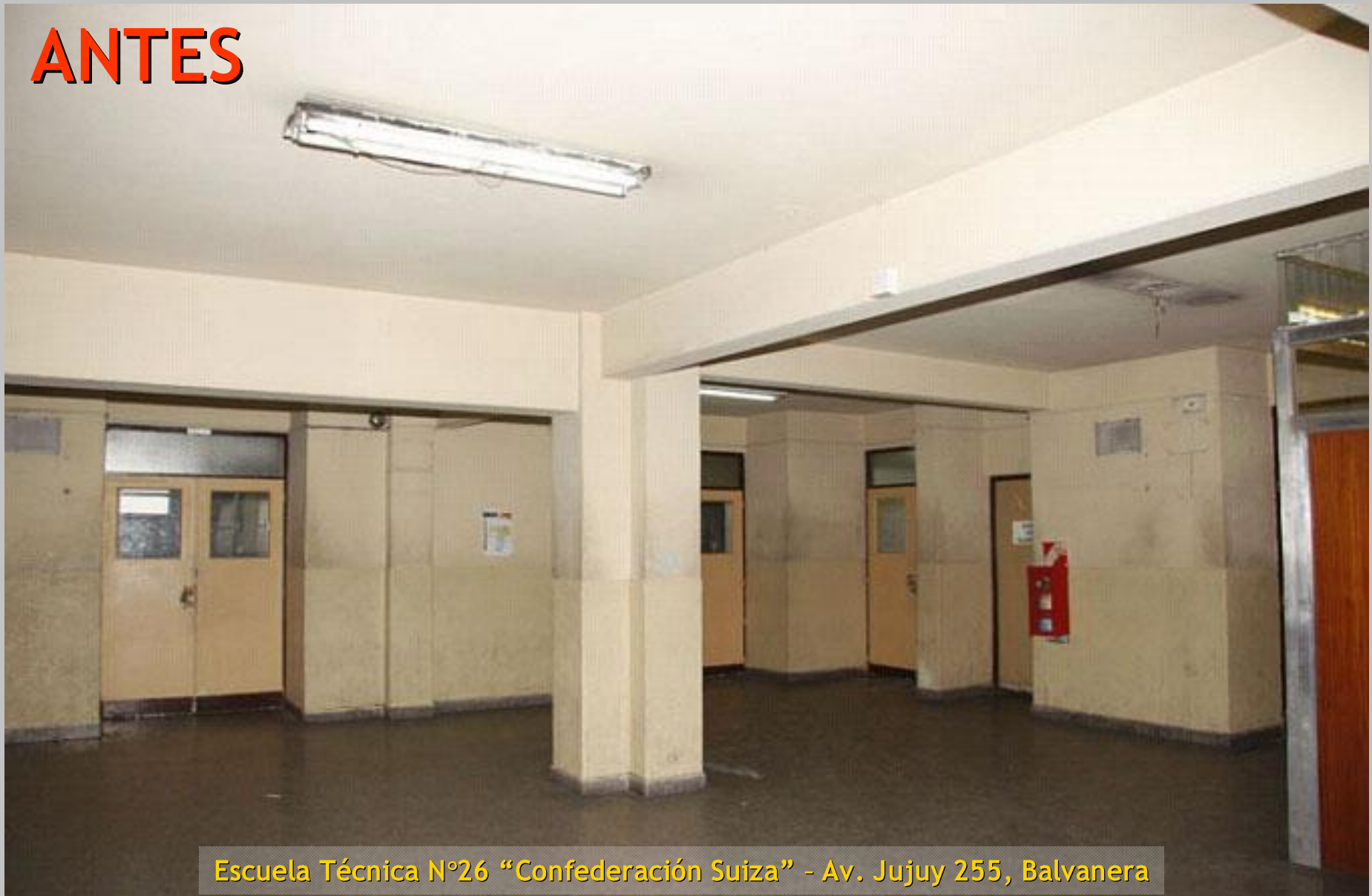
Escuela Técnica N°26 "Confederación Suiza" - Av. Jujuy 255, Balvanera