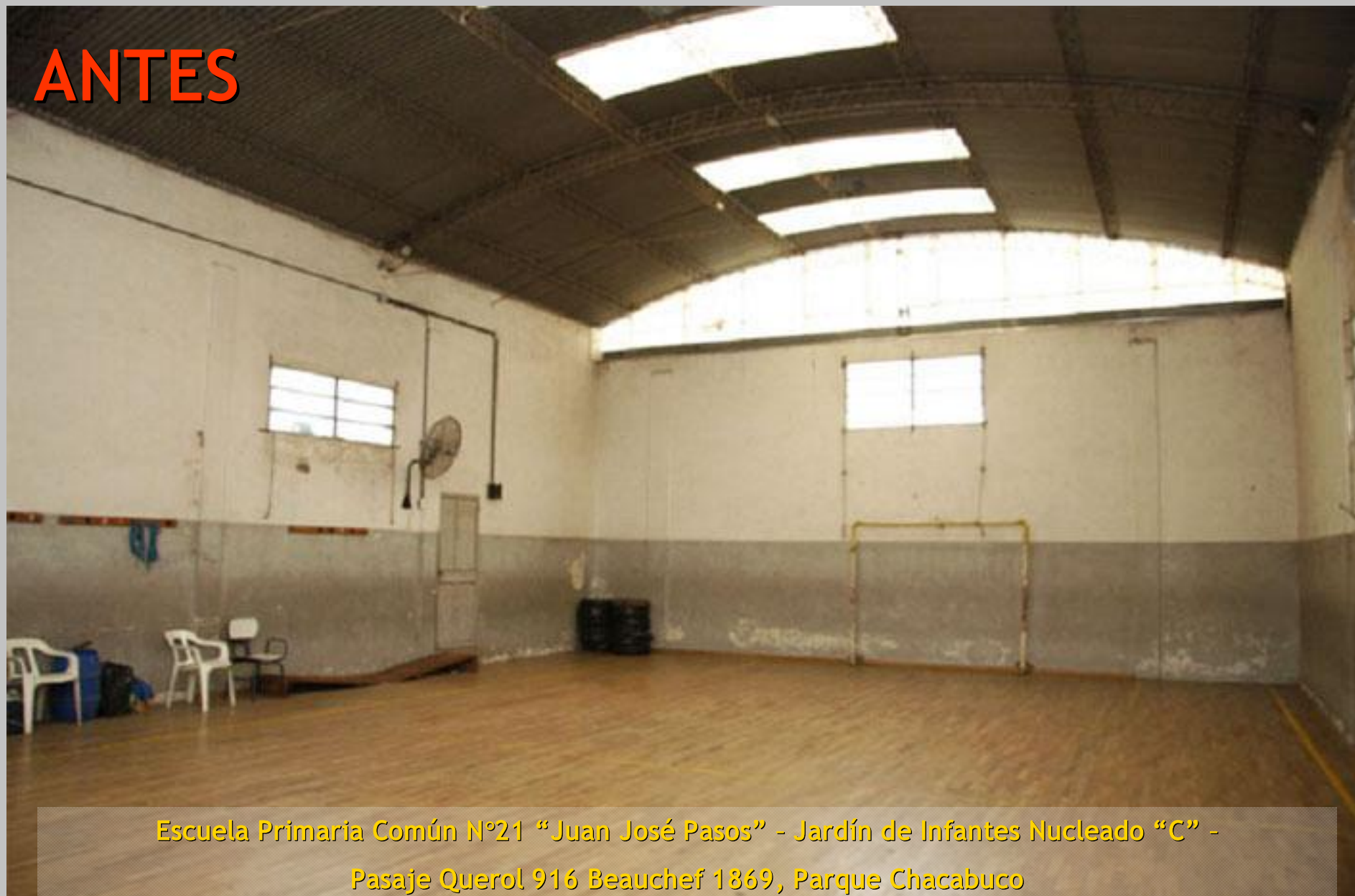
Escuela Primaria Común N°21 "Juan José Pasos" - Jardín de Infantes Nucleado "C" - Pasaje Querol 916 Beauchef 1869, Parque Chacabuco