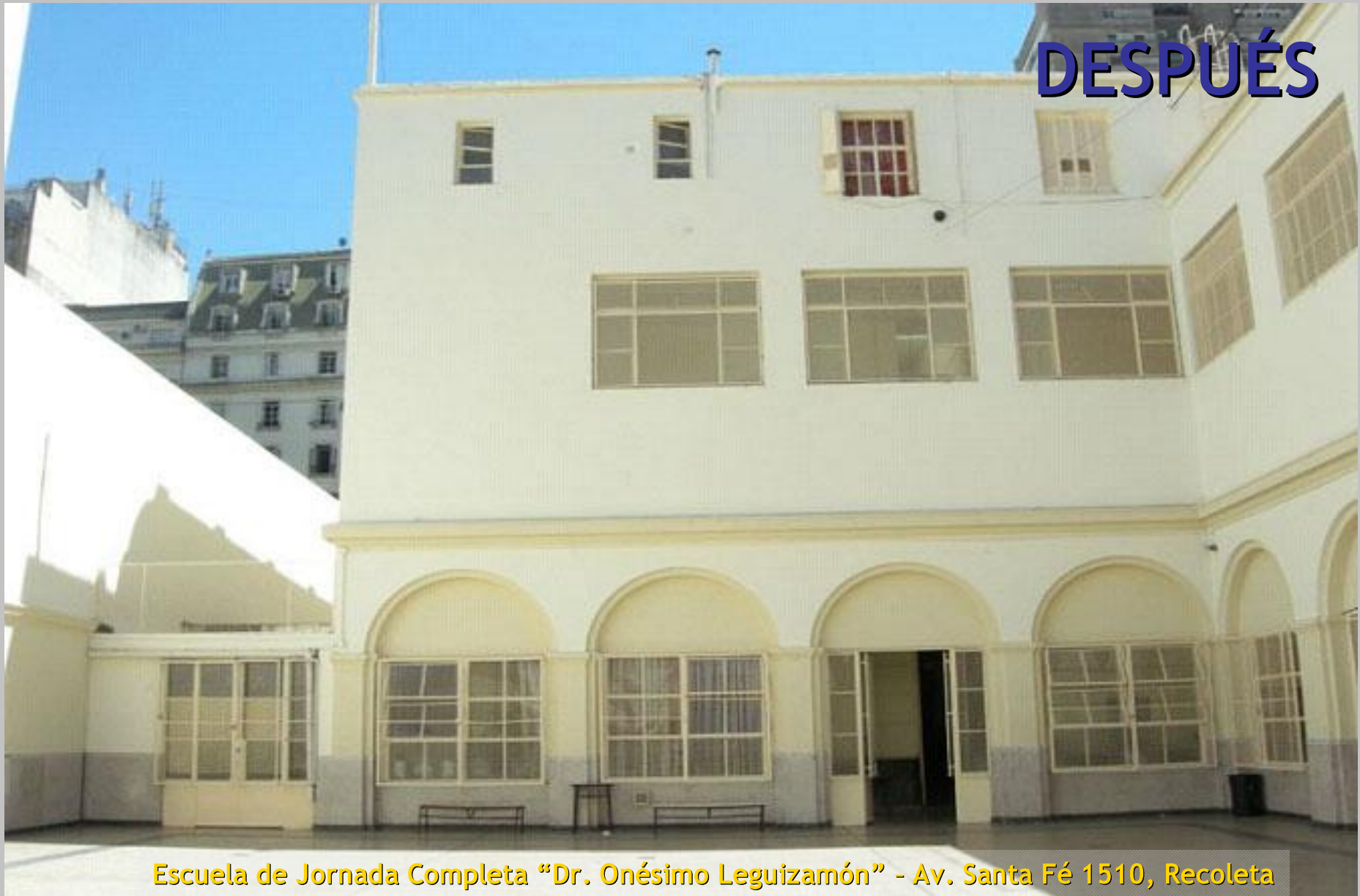
Escuela de Jornada Completa "Dr. Onésimo Leguizamón" - Av. Santa Fé 1510, Recoleta