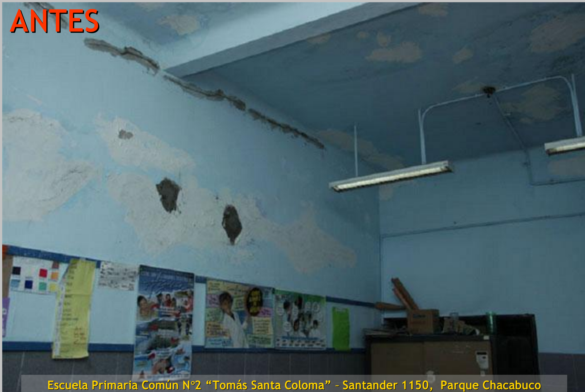
Escuela Primaria Común N°2 “Tomás Santa Coloma” - Santander 1150, Parque Chacabuco