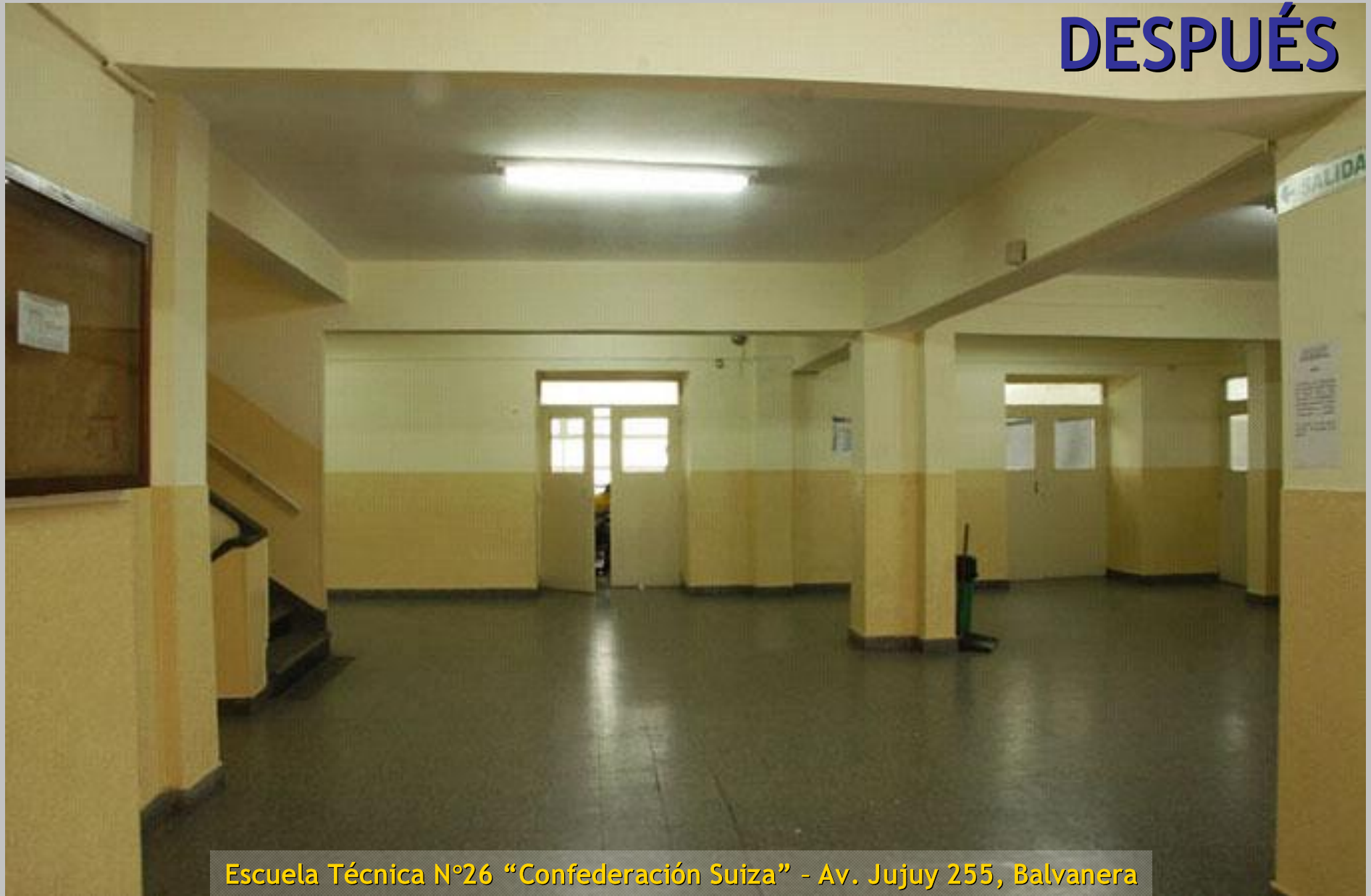
Escuela Técnica N°26 “Confederación Suiza” - Av. Jujuy 255, Balvanera