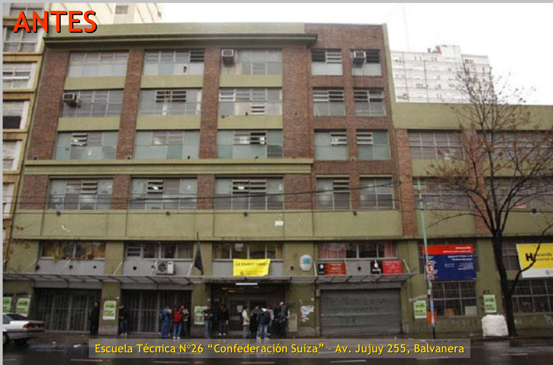
Escuela Técnica N°26 "Confederación Suiza" - Av. Jujuy 255, Balvanera