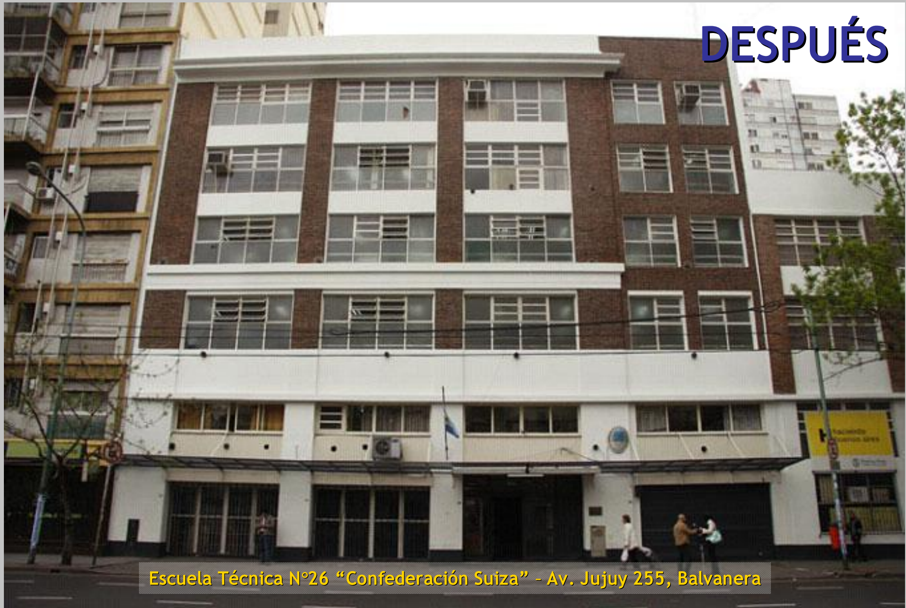
Escuela Técnica N°26 “Confederación Suiza” - Av. Jujuy 255, Balvanera