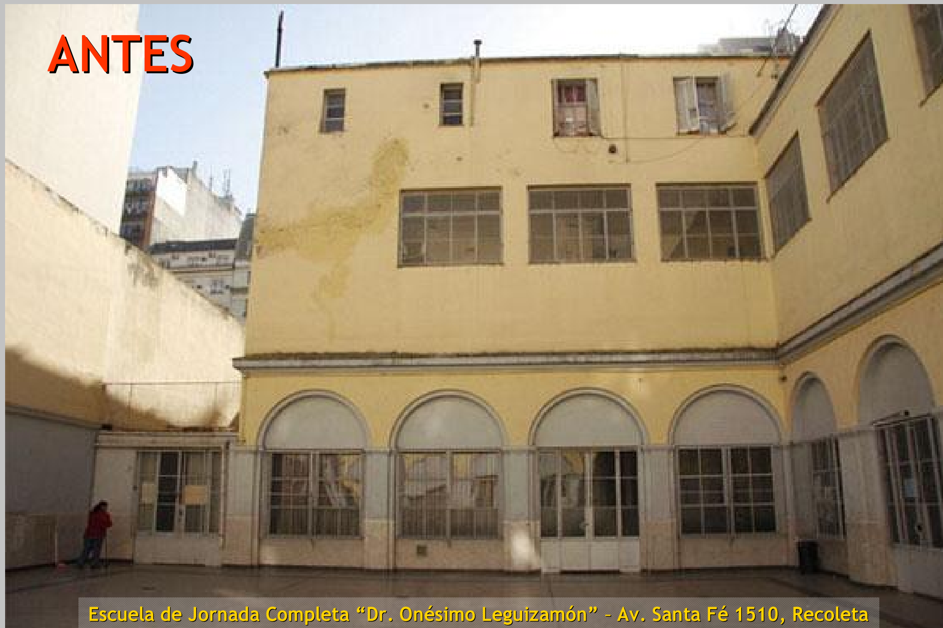
Escuela de Jornada Completa “Dr. Onésimo Leguizamón” - Av. Santa Fé 1510, Recoleta