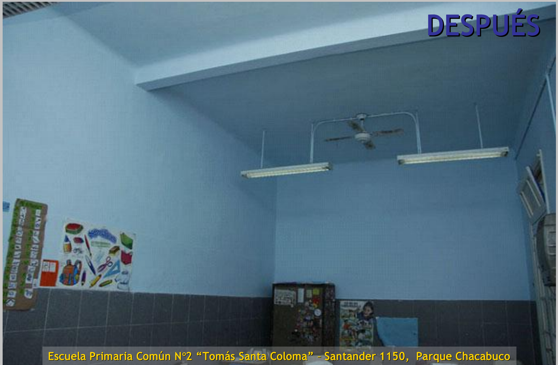
Escuela Primaria Común N°2 "Tomás Santa Coloma" - Santander 1150, Parque Chacabuco