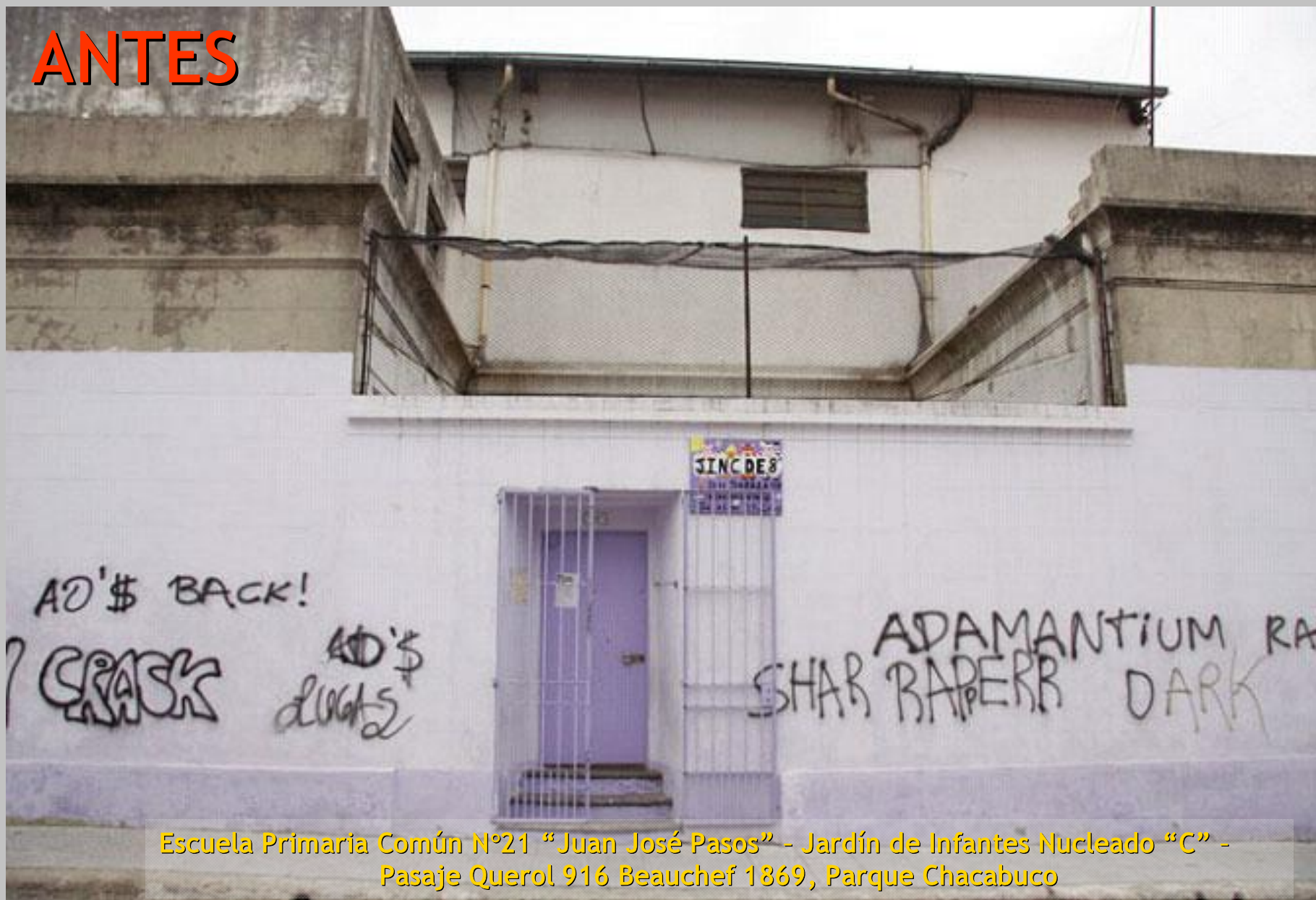
Escuela Primaria Común N°21 "Juan José Pasos" - Jardín de Infantes Nucleado "C" - Pasaje Querol 916 Beauchef 1869, Parque Chacabuco