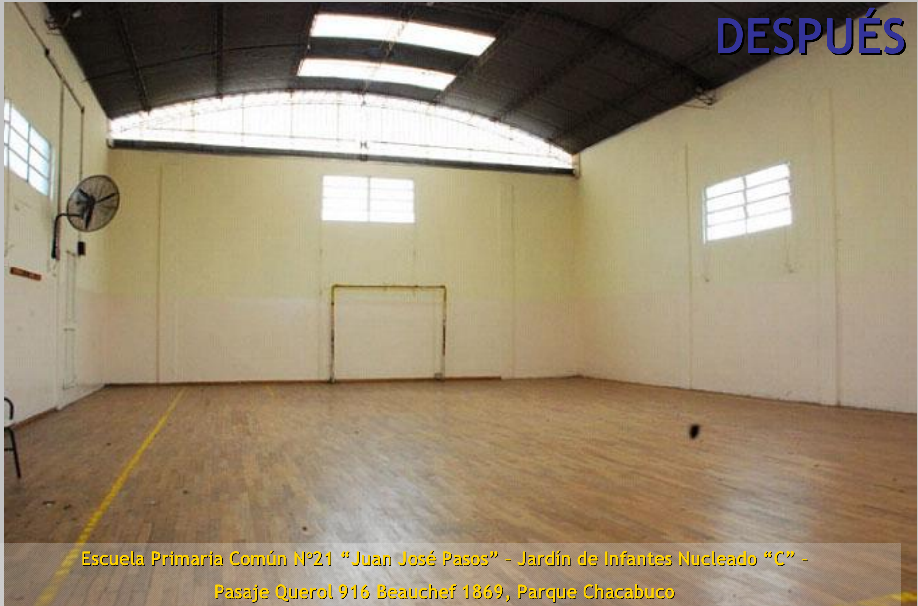
Escuela Primaria Común N°21 "Juan José Pasos" - Jardín de Infantes Nucleado "C" - Pasaje Querol 916 Beauchef 1869, Parque Chacabuco