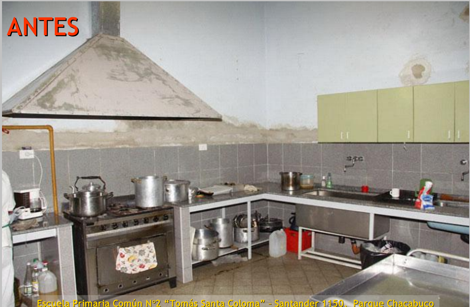
Escuela Primaria Común N°2 "Tomás Santa Coloma" - Santander 1150, Parque Chacabuco