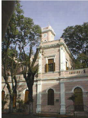
Museo Criollo de los Corrales Av. De los Corrales 6436, Ciudad de Buenos Aires

Proyectar fragmentos de la película Martín Fierro de Roberto Fontanarrosa para recuperar información y comparar con la que brindan otras fuentes trabajadas.